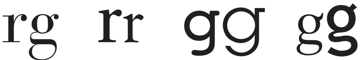
TERMINAL EN BOTÓN

Los trazos terminales tienen una función principalmente decorativa, y según su forma se pueden dividir en cuatro tipos: