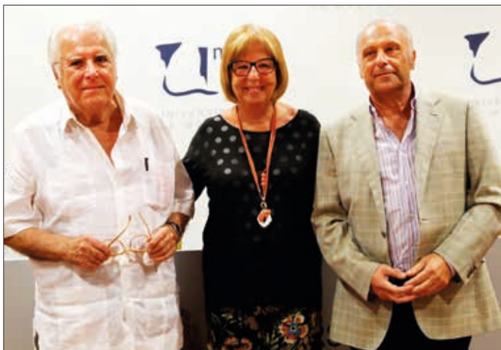
Momento de la firma del convenio de cesión.