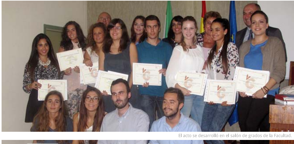
El acto se desarrolló en el salón de grados de la Facultad.