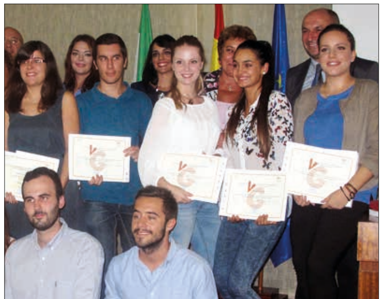
Los mejores alumnos de Económicas.