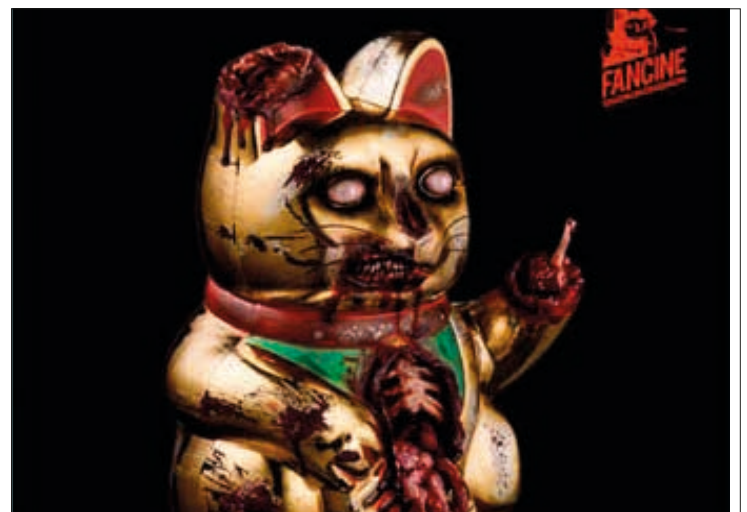
El característico gato del Festival de Cine Fantástico.

En www.fancine.org ya se incluye la programación de lo que se disfrutará del 20 al 27 de noviembre. Con dos ciclos dedicados al espionaje y a los fenómenos sobrenaturales, un concierto de bandas sonoras y la competición de diez largometrajes entre otras muchas actividades, la 24ª edición del Festival llegará este año al Paraninfo de la UMA y al Cine Albéniz con el mismo objetivo: la transmisión y la crítica cultural.