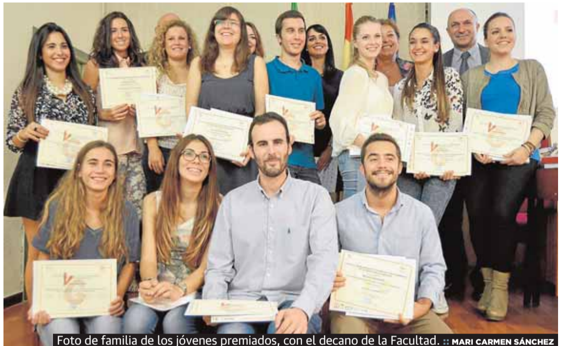
Foto de familia de los jóvenes premiados, con el decano de la Facultad.

Respecto a la tasa de abandono, Luque explicó que en Económicas es menor que en otras titulaciones «por-