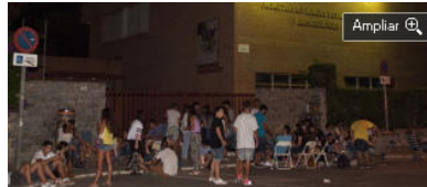
Decenas de alumnos se congregaron el lunes por la noche para elegir el turno de clases. Juan Miguel Pérez Ramos

Sentados en sillas provistos de agua e incluso con un juego de cartas y una mesa para echar las horas. Casi 300 alumnos de la Facultad de Ciencias Económicas y Empresariales pasaron la noche del lunes en la puerta del centro a la espera de que abriera para poder matricularse. Una situación que ocurre por tercer año consecutivo y, a pesar de las quejas, la escena vuelve a repetirse por una cuestión informática sin resolver.