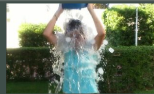
#cubosolidarioMLG Los retos de la iniciativa #IceBucketChallenge llegan a la sociedad malagueña #cubosolidarioMLG