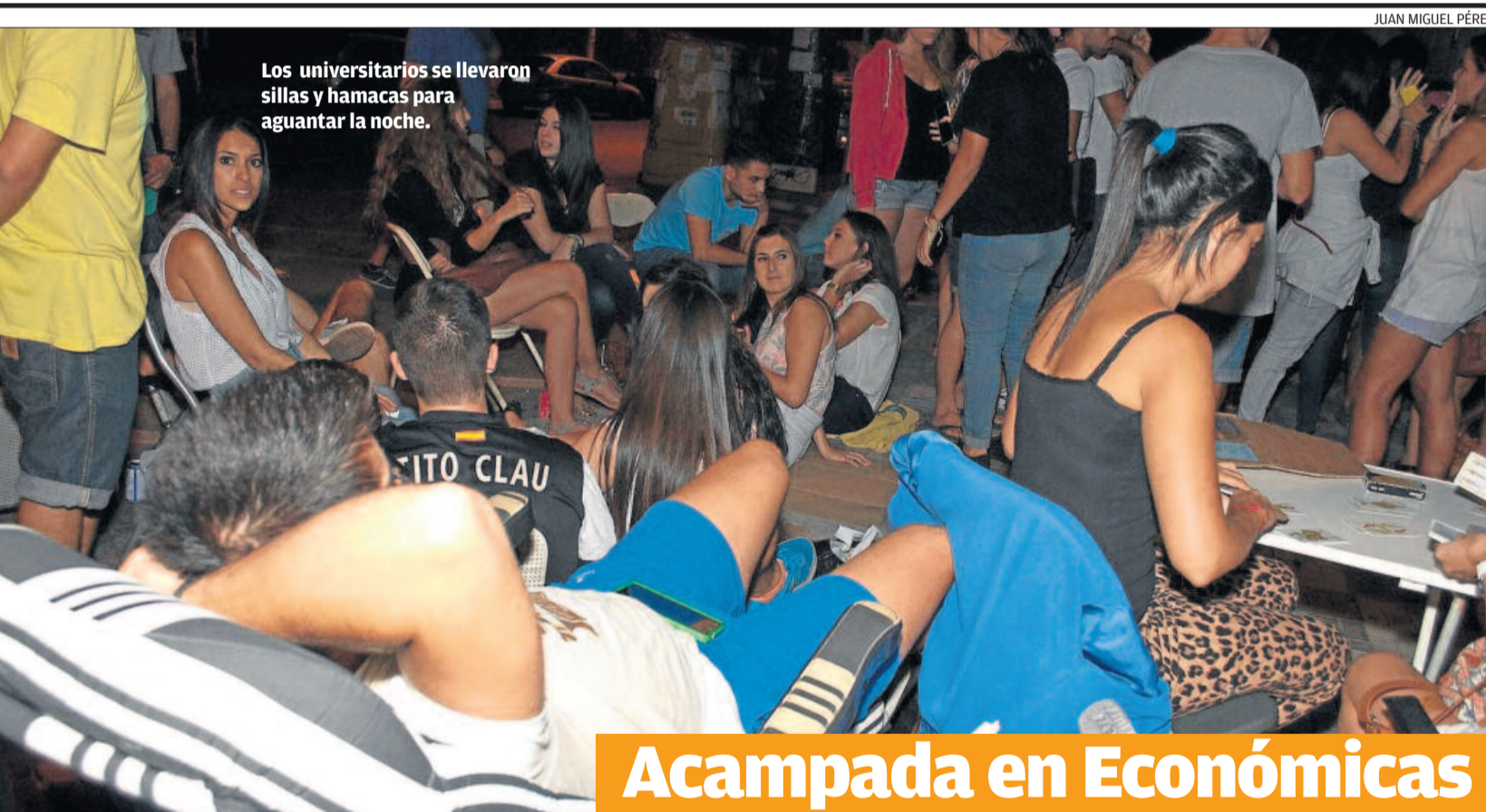
Los universitarios se llevaron sillas y hamacas para aguantar la noche.

Aulas prefabricadas en la provincia ▶ Mijas, Estepona, Marbella y Rincón de la Victoria inician el curso con cerca de mil escolares en aulas prefabricadas