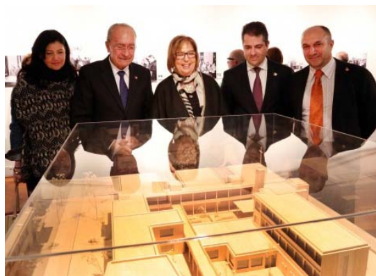
De izqda. a dcha., el alcalde de Málaga, la rectora, el diputado de Presidencia y el decano de la Facultad

MÁLAGA.-La Sala de la Muralla del Rectorado acogerá hasta el 26 de febrero la exposición "50 años Facultad de Ciencias Económicas y Empresariales", una muestra de fotografías y documentos del inicio de los estudios de Economía en la Facultad de la UMA.