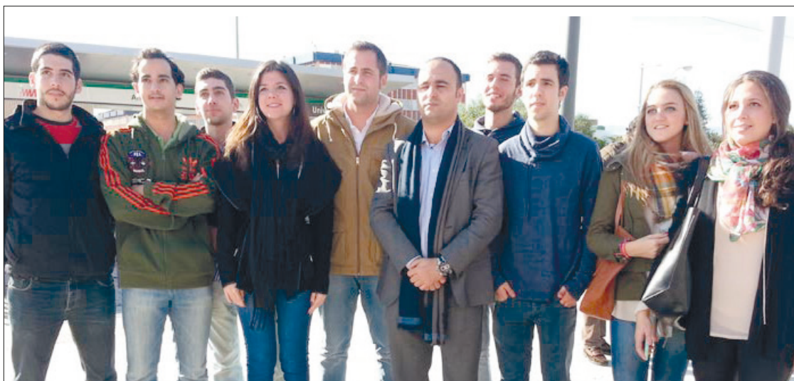
Concejales y miembros de Nuevas Generaciones en la parada de metro.

La moción del Grupo Popular pide a la Junta una bonificación para viajar en Metro que beneficie a jóvenes y estudiantes, quienes siguen encontrando el viaje en autobús urbano más barato