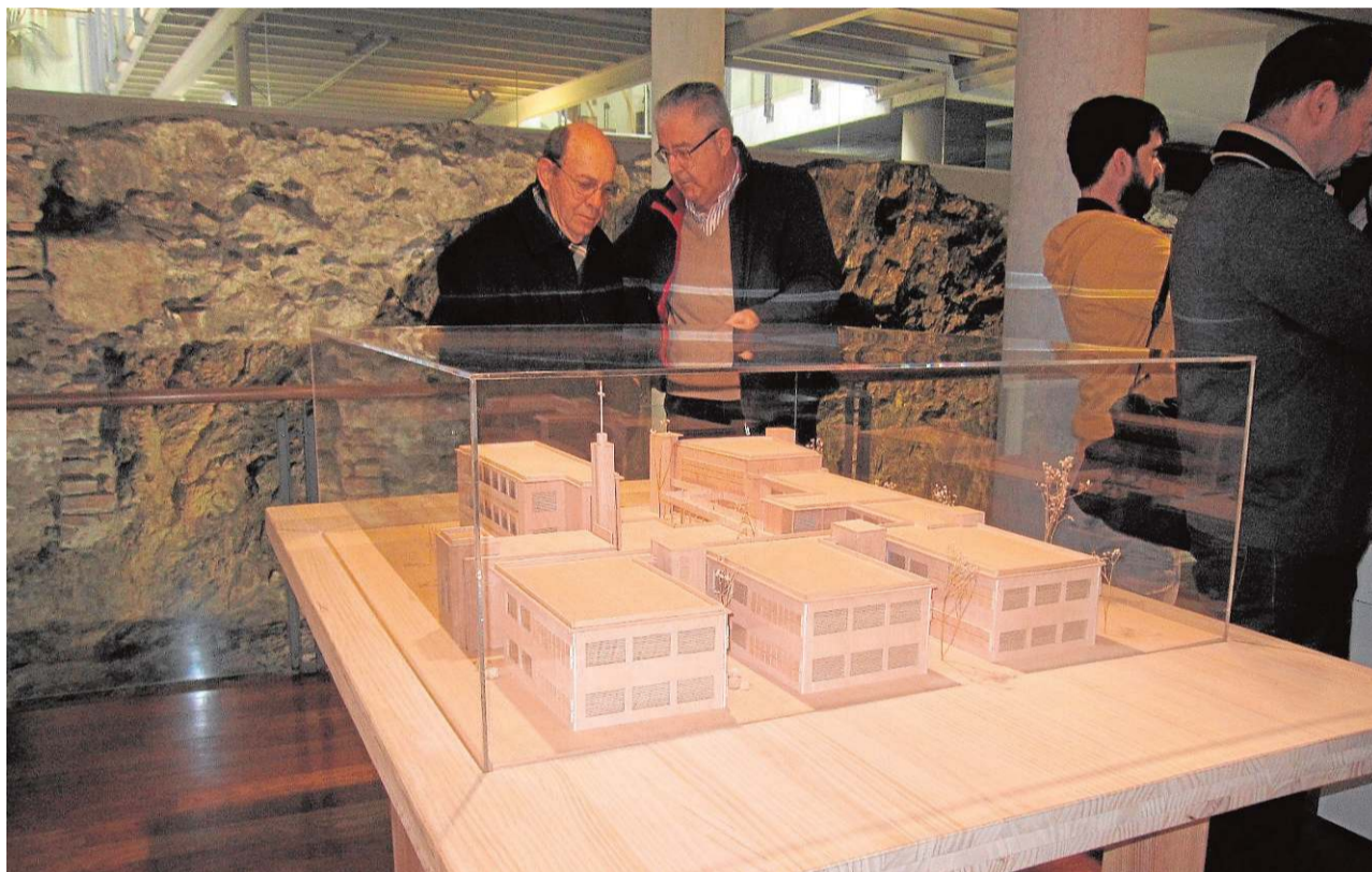
La maqueta del edificio de la facultad ha sido realizada por una profesora y alumnos de Bellas Artes. :: CRÓNICA

Desde el 2001, la Facultad de Turismo, cuenta con un aula equipada con once cabinas de cata con cocina, estufa de laboratorio friocalor y un baño ultrasónico para limpiar, entre otros equipamientos. Las aulas de catas se suelen usar para docencia en grado y además para: cursos de enología, cursos de iniciación de cata en general, al igual que para expertos e incluso empresas.