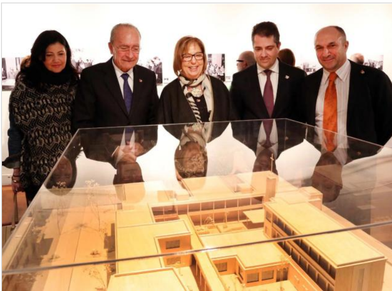
El Rectorado acoge una muestra que conmemora los 50 años de la Facultad de Ciencias Económicas y Empresariales