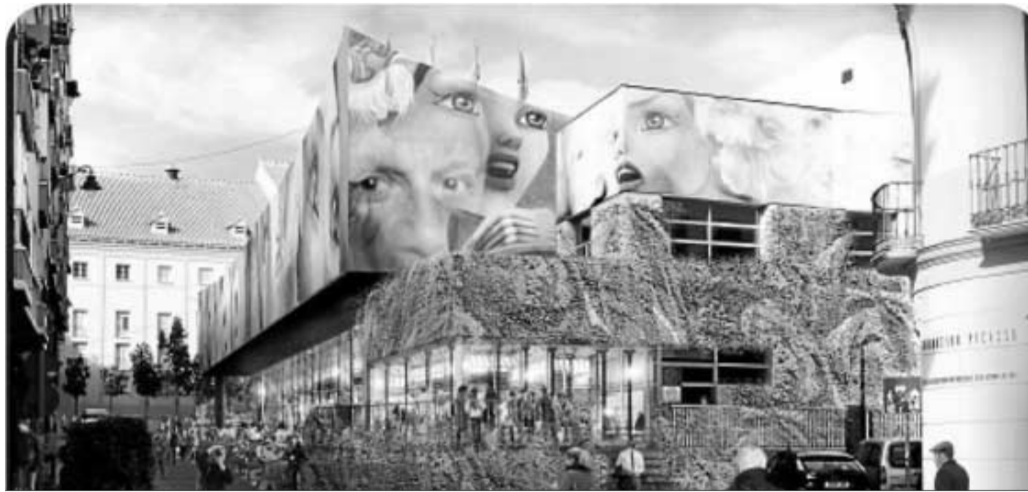
Recreación de la fachada propuesta en el proyecto de rehabilitación del mercado de la Merced de Málaga.