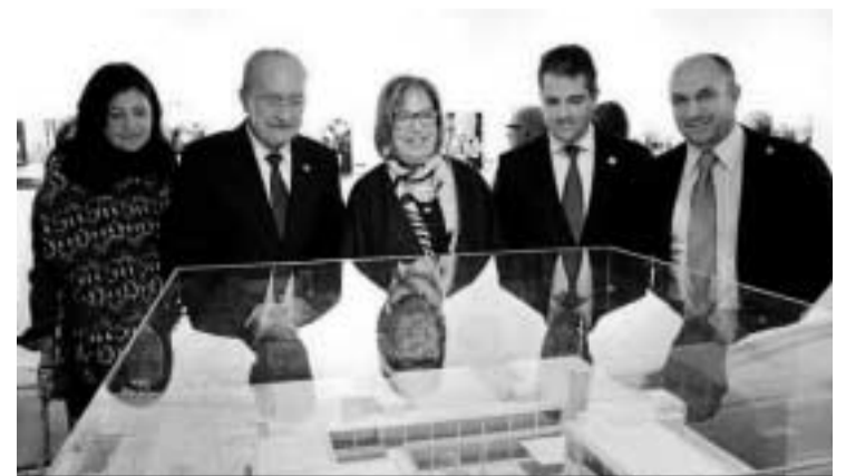
Presentación, ayer, de la exposición.

1965, inicio de los estudios y acto de primera piedra del primer edificio, y 1967, inauguración del edificio. Las imágenes pertenecen al archivo fotográfico del Centro de Tecnología de la Imagen de la UMA. Además, se exhiben los documentos más importantes en los inicios de este centro, como el acta de constitución de la facultad.