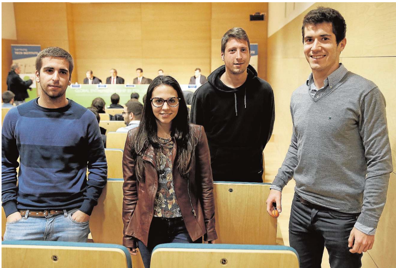
Cuatro alumnos del curso, en el acto de entrega de diplomas.