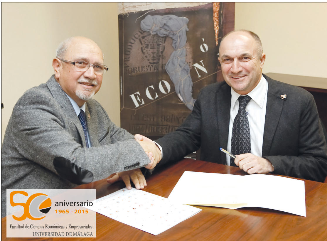
50 aniversario 1965 - 2015 Facultad de Ciencias Económicas y Empresariales UNIVERSIDAD DE MÁLAGA

La Facultad y el Ateneo comparten trayectorias paralelas desde el año 1965, en el que comenzaron una andadura de colaboración