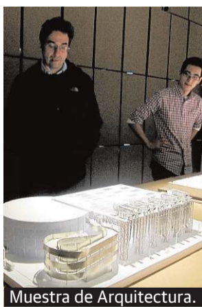
Muestra de Arquitectura.

en formación', que la Escuela de Arquitectura inauguró el pasado 11 de diciembre en el Rectorado, se exhibe desde el 29 de enero en la Sala de la Axarquía del Instituto en Rincón de la Victoria (Málaga). La muestra repasa la historia