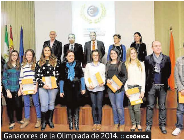
Ganadores de la Olimpiada de 2014. CRÓNICA

CRÓNICA. Con motivo del 50.º aniversario de la Facultad de Económicas de la UMA, la Olimpiada Española de Economía, en su fase nacional, se celebrará este año por primera vez en Málaga. El acto –que no se ha celebrado nunca antes en Andalucía– tendrá lugar del 24 al 26 de junio de 2015 en la facultad del campus de El Ejido. Hasta la fecha sólo se habían celebrado en este centro las Olimpiadas de Economía local entre los alumnos de bachillerato de la