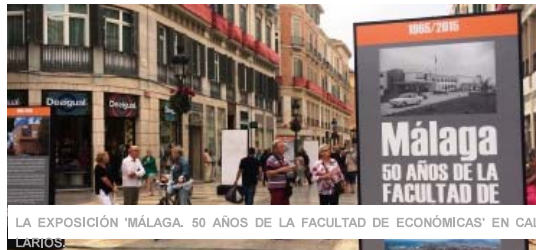
LA EXPOSICIÓN 'MÁLAGA. 50 AÑOS DE LA FACULTAD DE ECONÓMICAS' EN CALL LARIOS