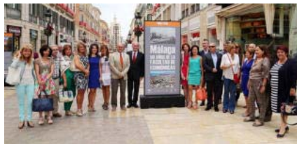
Los 50 años de la Facultad de Económicas, en la calle Larios.