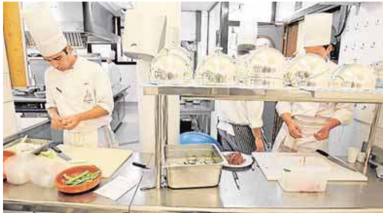
Alumnos de La Cónsula, durante sus prácticas de cocina.