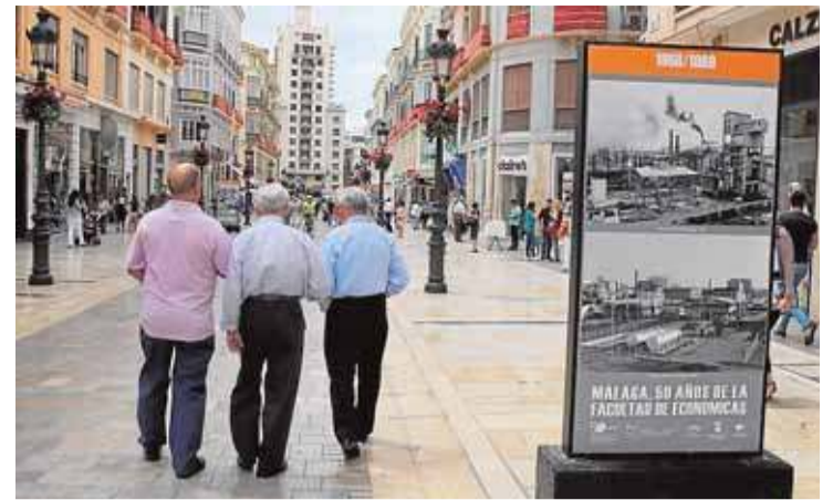
25 grandes paneles resumen 50 años de historia.

Respecto al curso que han perdido los alumnos de La Fonda –no han dado ninguna clase–, el director general de la Agencia de Empleo señaló que se reunirá en los próximos días con los alumnos para buscar una solución, entre las que no se descartará repetir el curso.