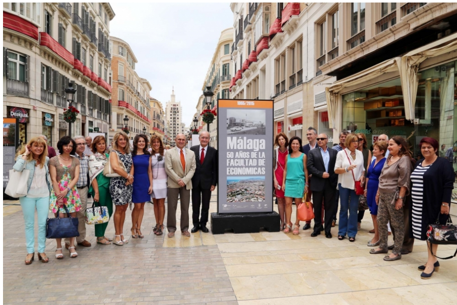
Inauguración de la muestra en calle Larios/ UMA

50 años de la Facultad de Económicas Una exposición en la calle Larios recorre en 25 paneles el pasado de la