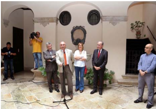
Presentación de la exposición

MÁLAGA.- La calle más céntrica de Málaga, Larios, exhibe desde hoy, y hasta el próximo 15 de julio, el pasado de la Facultad de Económicas en 25 paneles a dos caras, en los que los malagueños y visitantes pueden hacer un repaso de la historia del centro de la UMA, que este curso académico conmemora su 50 aniversario.