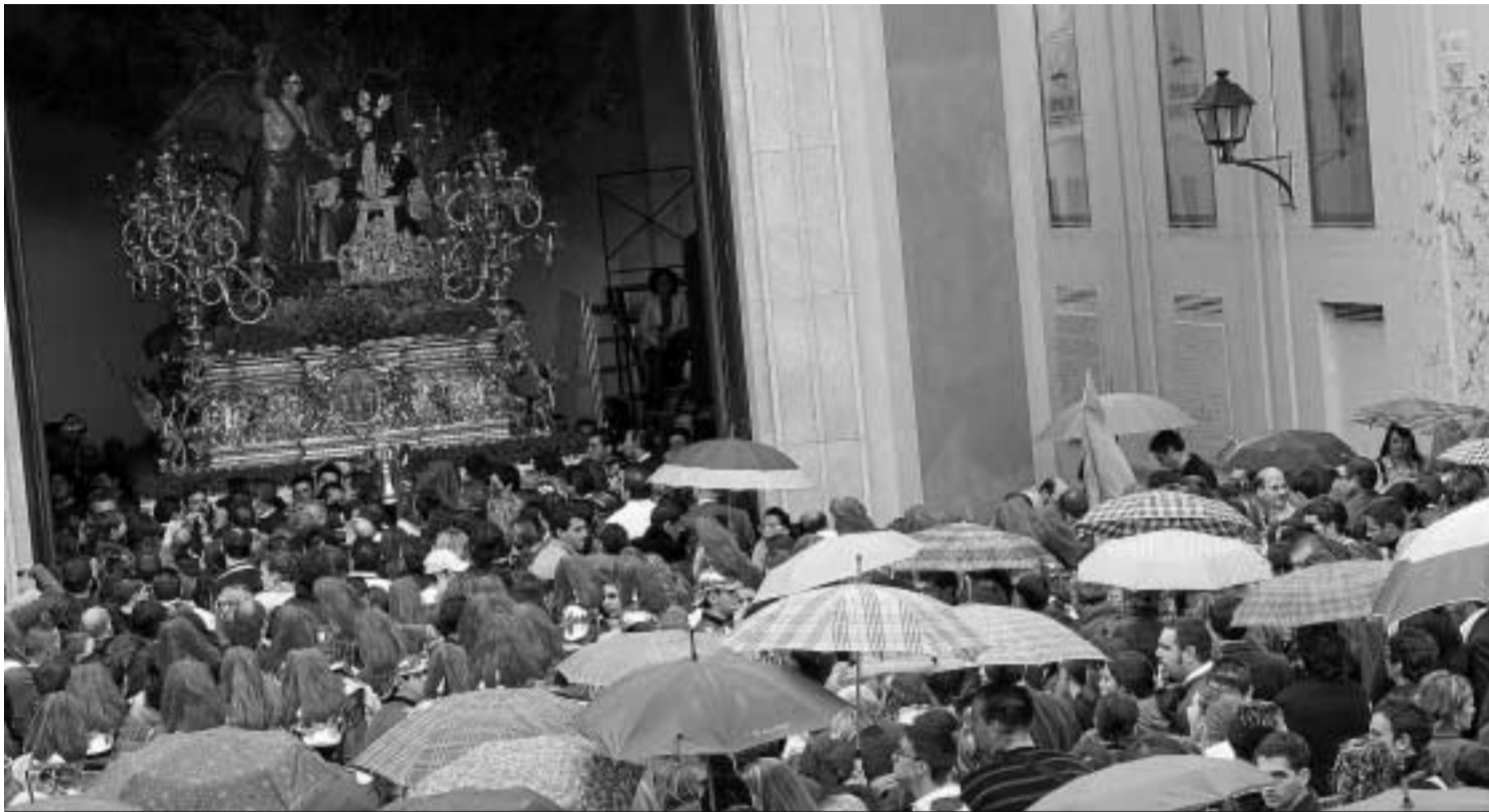
Cientos de malagueños en la puerta de la casa hermandad del Huerto.