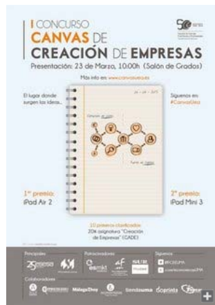
Cartel del I Premio Canvas. / M. G.