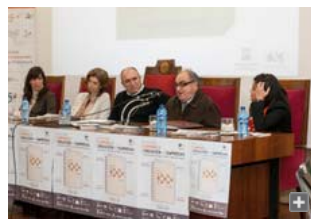
Momento de la presentación del concurso.

El llamado método Canvas es una herramienta de diseño de modelos de negocio que, a diferencia del tradicional Plan de Empresa, lo sustituye en un sencillo esquema integrado por nueve apartados y en el que a simple vista se puede resumir los pilares principales del proyecto como conocer al cliente, identificar qué problemas o necesidades tiene, definir una solución y saber cuánto estaría dispuesto a pagar por ello.