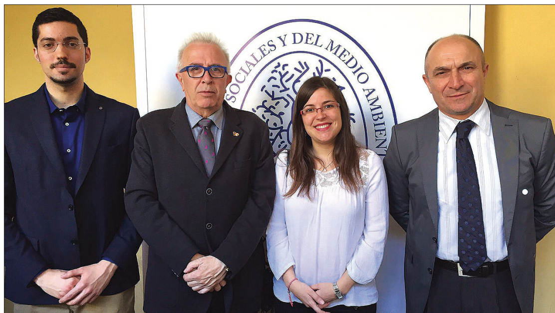
Los estudiantes premiados junto al consejero de Economía e Innovación y al decano de Económicas.