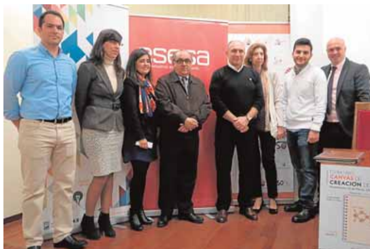
Presentación del concurso. :: SUR

Podrán participar los alumnos del centro de Económicas y el método que deben seguir se basa en la idea de plasmar el proyecto de negocio en un folio, explicándolo en nueve apartados. «Pueden participar tan-