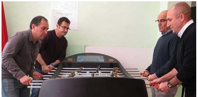
Los decanos de la Universidad de Málaga han sido los protagonistas en el torneo de fútbol.

Para finalizar, la semana del patrón también contará con actividades deportivas que tendrán lugar el jueves 26. En los jardines de la facultad se darán 'masterclass' de bailes latinos, zumba y 'funcional training'; por otro lado, en las pistas del Ayuntamiento se jugará al baloncesto en la modalidad 3x3.