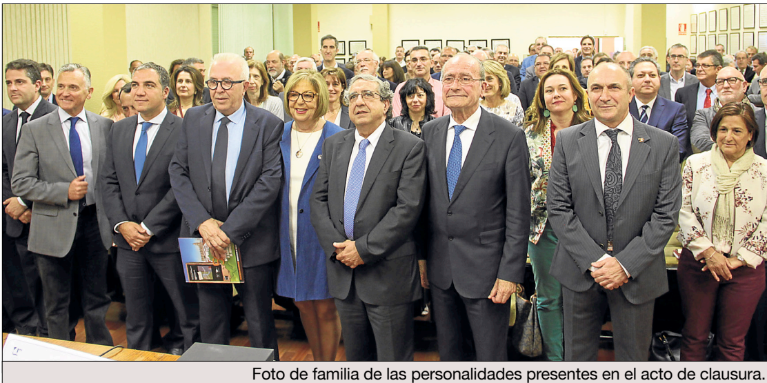
Foto de familia de las personalidades presentes en el acto de clausura.

Tras dos años de conmemoraciones el centro festejó la clausura de la efeméride junto a las instituciones y personalidades colaboradoras