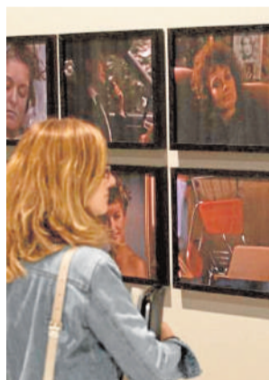
Muestra de David Lynch.

Rectorado en horario de lunes a sábado de 11 a 14 y de 18 a 21 horas de la exposición 'Surrealismo fantástico de David Lynch'. Como acto inicial de la próxima edición de Fancine, esta muestra ras- trea los vínculos de las