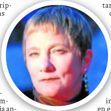
Anita Borg. :: ANITABORG.ORG

La informática también fundó 'The Anita Borg Institute for Women and Technology' para animar a las mujeres a introducirse en el terreno de la informática y la tecnología.