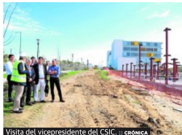
Visita del vicepresidente del CSIC. :: CRÓNICA

nes presentadas por participantes, el encuentro tratará de aportar ideas y soluciones a temas como los refugiados, la vivienda, el maltrato, la homofobia, los emigrantes o la xenofobia. La semana pasada ya se habían inscrito más de 200 personas, superando así la cifra de participantes en el I Congreso, que tuvo lugar en el año 2009.