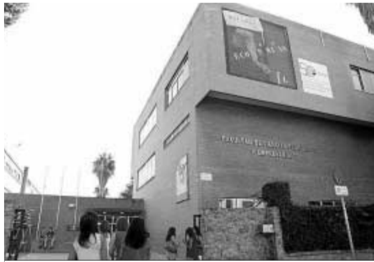
El centro ya luce en su fachada el cartel conmemorativo del aniversario.

El año académico ha empezado ya para algunas facultades de la UMA. Las primeras en comenzar fueron Psicología y Medicina que lo hicieron el 19 y 21 de este mes respectivamente. El próximo día 26 les seguirán Telecomunicaciones, Económicas, Informática, Derecho; Enfermería, Comercio, Turismo, Educación, Trabajo Social y la Politécnica. Al día siguiente lo hará Ciencias y tras ella el 30 Magisterio. Las demás empezarán el 3 de octubre.