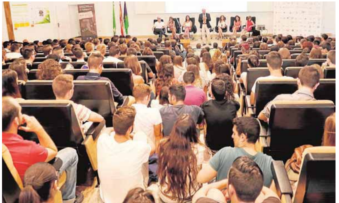
El Paraninfo se quedó pequeño para acoger a los alumnos de primero de Económicas :: DONOSO

Invitó a los estudiantes a ser los mejores, a obtener el mejor rendimiento académico, pero también a formarse en idiomas, a hacer prácticas y estancias en el extranjero, y a aprovechar todos los recursos y servicios universitarios, «para que cuando salgáis seáis los más competitivos». Los grados de Económicas disfrutaban de unas tasas de in-