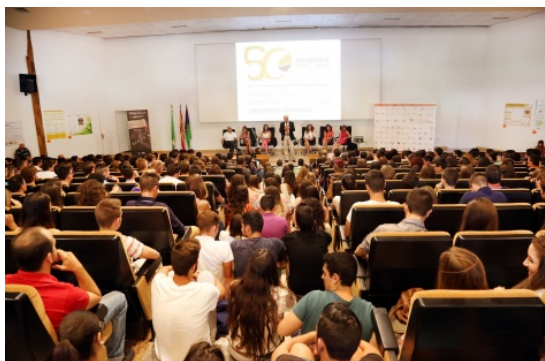
Instante del acto de inauguración del curso académico de la Facultad de Económicas