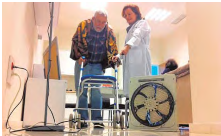
Dos profesores recrean uno de los casos clínicos que plantean a los alumnos en este laboratorio.