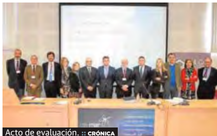
Acto de evaluación. CRÓNICA

CRÓNICA. El Campus de Excelencia Internacional del Mar (CEI.Mar) ha obtenido la calificación A en su progreso, es decir, la máxima que otorga la comisión internacional evaluadora de los Campus de Excelencia Internacionales. Esa es la conclusión a la que ha llegado la propia comisión tras revisar la documentación remitida para la evaluación de los últimos doce meses de gestión. La comisión internacional considera que CEI.Mar es un «centro bien organizado» que para la consecución de sus fines ha optado por «la incorporación de gran número