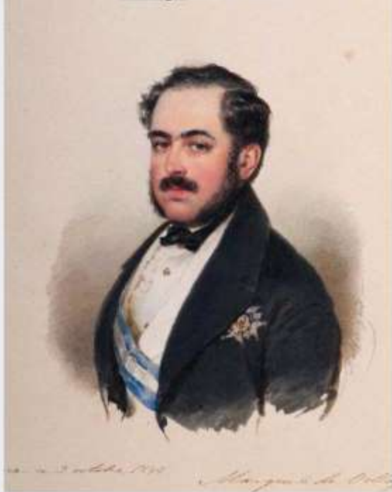
Embajador de Carlos M a Isidro de Borbón, pretendiente al trono como Carlos V, ante la corte rusa entre 1837 a 1839. Nunca fue reconocido oficialmente como embajador