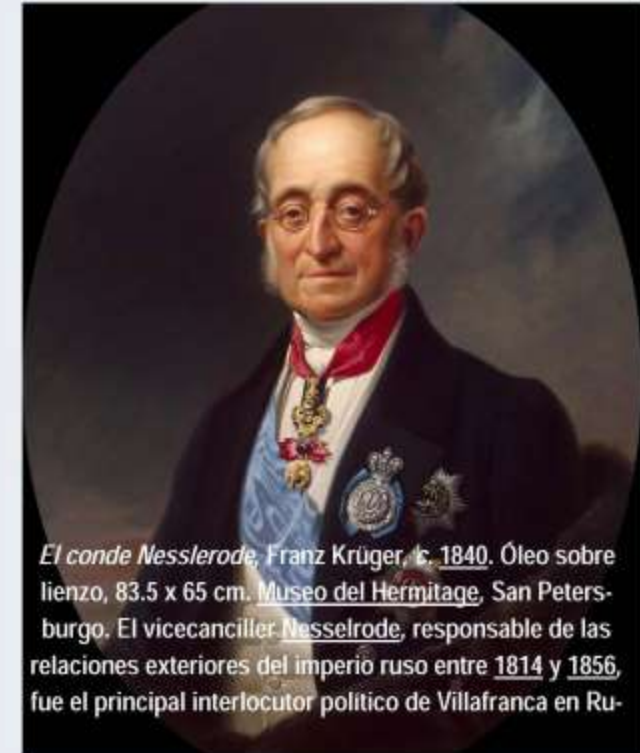
El conde Nesselrode, Franz Krüger, c. 1840. Óleo sobre lienzo, 83.5 x 65 cm. Museo del Hermitage, San Petersburgo. El vicescanciller Nesselrode, responsable de las relaciones exteriores del imperio ruso entre 1814 y 1856, fue el principal interlocutor político de Villafranca en Ru-