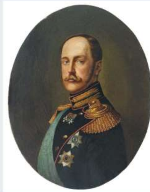
Emperador y Autócrata de Todas las Rusias, Rey de Polonia, Gran Duque de Finlandia (1825-1855)