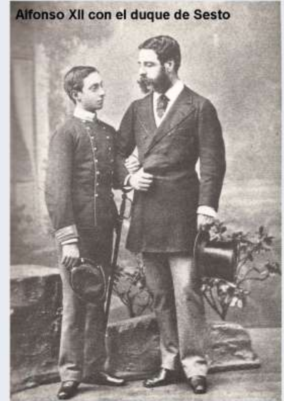
Alfonso XII con el duque de Sesto