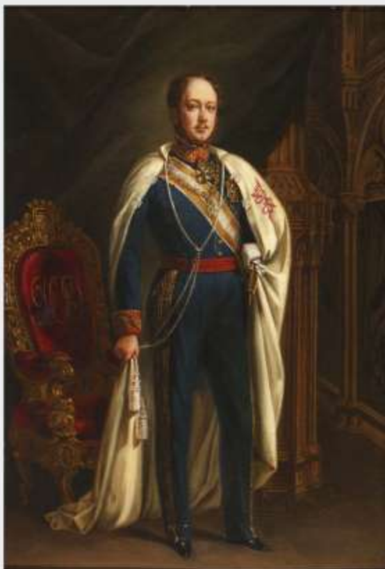
Mariano Téllez-Girón, XII duque de Osuna. 1857.