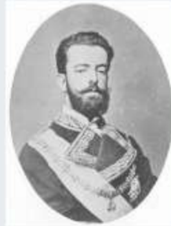
Amadeo de Saboya, Rey de España entre 1871-1873