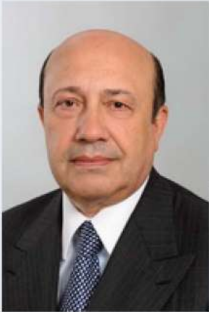
Igor Serguéyevich IVANOV Embajador Extraordinario y Plenipotenciario (1991-1993)