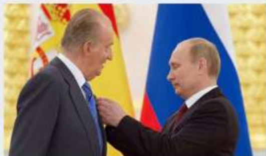
El presidente de Rusia, Vladimir Putin, entregó hoy al rey de España, Juan Carlos I, el diploma y el premio estatal de la Federación Rusa en el Gran Palacio del Kremlin, concedido por "los importantes éxitos en las actividades de carácter humanitario" durante el año 2010. La Voz de Rusia, 19.07.2012