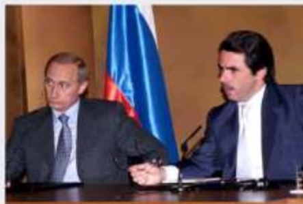
Entrevista de Putin y Aznar en Madrid en el

Nombramiento de un embajador de plena confianza del Gobierno español para las futuras relaciones, con cumbres bilaterales