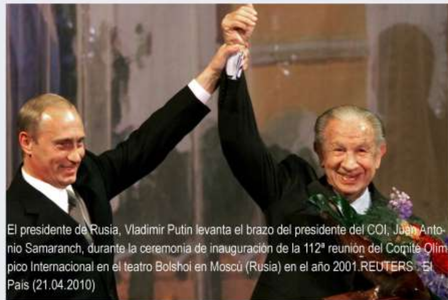
El presidente de Rusia, Vladimir Putin levanta el brazo del presidente del COI, Juan Antonio Samaranch, durante la ceremonia de inauguración de la 112ª reunión del Comité Olímpico Internacional en el teatro Bolshoi en Moscú (Rusia) en el año 2001.

Entrevista a un periodista El País (19.07.1977), en la que expuso: « La primera lección que he aprendido -nos dice para terminar la charla- es que soy el brazo ejecutor de las órdenes que emanan del Ministerio español de Asuntos Exteriores, y estoy dispuesto a procurar intensificar las relaciones comerciales, culturales, científicas y deportivas que tienen que llevar a un acercamiento real y más exacto de lo que son hoy en día nuestros pueblos. »