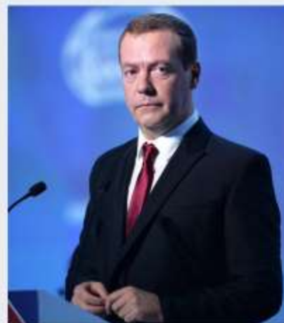
Primer Ministro Dmitry Medvedev during Sochi International Investments Forum 2016.