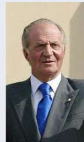
D. Juan Carlos I, Rey de España.