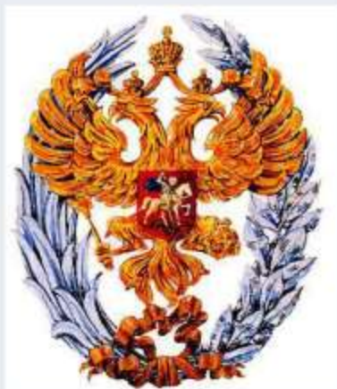
Premio Estatal de la Federación de Rusia