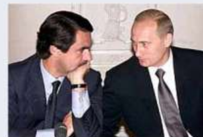
Entrevista de Putin y Aznar en Moscú en el 2001 (El País 23.05)

Las relaciones entre Aznar y Yeltsin fueron tensas a causa de la crisis balcánica. Con Putin llegó la distensión