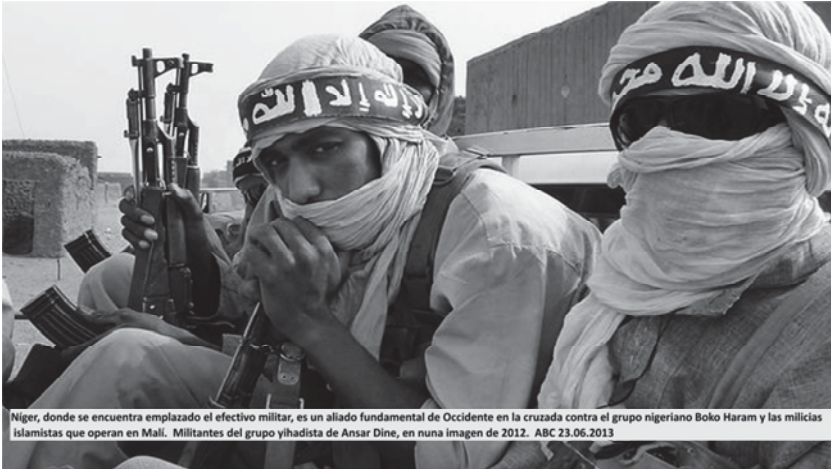
Niger, donde se encuentra emplazado el efectivo militar, es un aliado fundamental de Occidente en la cruzada contra el grupo nigeriano Boko Haram y las milicias islamistas que operan en Mali. Militantes del grupo yihadista de Ansar Dine, en una imagen de 2012.

Esta elipse de inestabilidad no solo abarca el Sahel sino que se ha expandido sobre las áreas desérticas de Argelia, y Libia, en donde los grupos yihadistas campean, siendo casi imposible reducirlos en la inmensidad de las arenas. Por el sur la inestabilidad ha alcanzado Centroáfrica y de esta forma se enlaza con otra de las elipses más conflictivas del mundo, la región de los Grandes Lagos y la República Democrática del Congo.