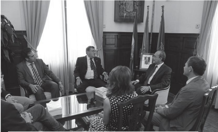
El Coronel Vidal exponiendo al Alcalde los proyectos del Foro