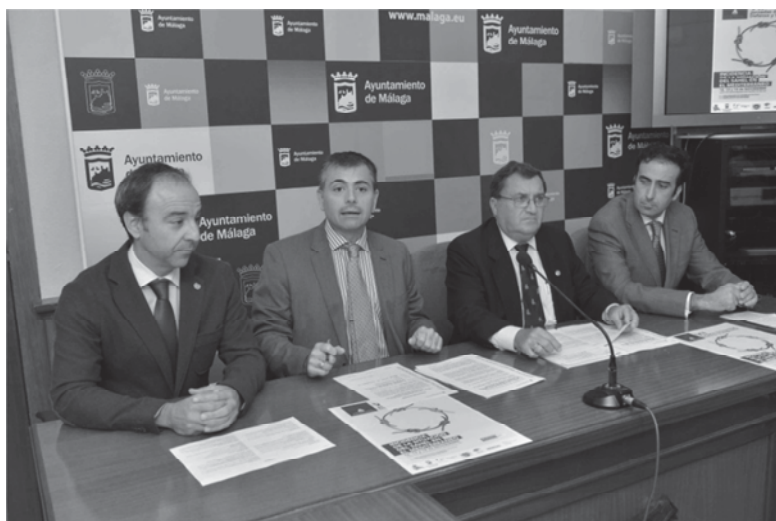
De izda. a dcha. Vicerrector de Comunicación y Proyección Internacional de la UMA, Concejal de Seguridad Ciudadana y Relaciones Institucionales Internacionales, Director del Foro y Representante de Unicaja.