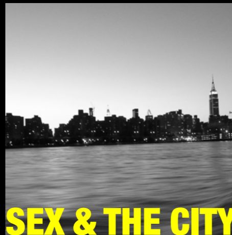
SEX & THE CITY