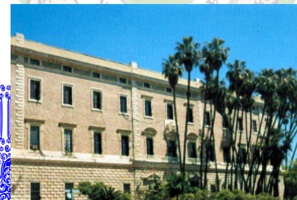
REAL ADUANA DE MÁLAGA

VA A CREAR EL ARCHIVO GENERAL DE INDIAS. NO OBSTANTE FUE EN AMÉRICA, DONDE ESTA FAMILIA FORJÓ SU FAMA, CONCENTRANDO SUS ACTUACIONES EN EL VIRREINATO DE LA NUEVA ESPAÑA, QUE ENTONCES OCUPABA LOS ACTUALES ESTADOS DE GUATEMALA, COSTA RICA, NICARAGUA, HONDURAS, EL SALVADOR, MÉXICO Y UNA GRAN PARTE DE LOS ESTADOS UNIDOS DE NORTEAMÉRICA. ALLÍ CREARON NUEVAS CIUDADES, ESTABLECIERON INSTITUCIONES CULTURALES, CONSTRUYERON EDIFICIOS PÚBLICOS, DESARROLLARON LA ECONOMÍA Y EL COMERCIO, Y ASENTARON EL PODER DEL IMPERIO ESPAÑOL FRENTE A LOS INGLESES EN NORTEAMÉRICA, APOYANDO LA INDEPENDENCIA DE LAS ANTIGUAS COLONIAS BRITÁNICAS.