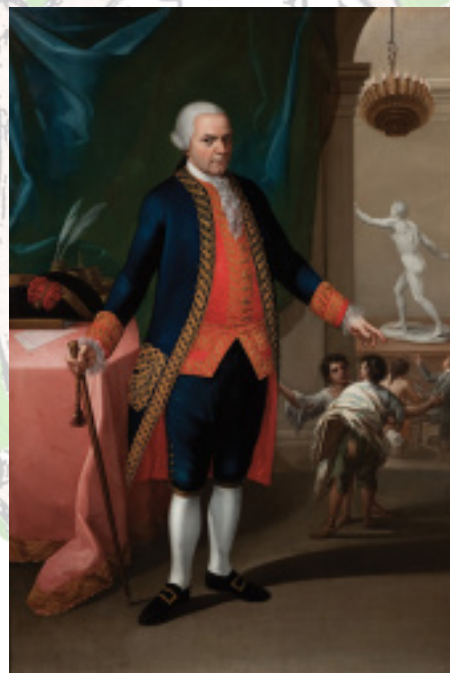
MATÍAS DE GÁLVEZ, ANÓNIMO S. XVIII, MUSEO NACIONAL DE MEXICO

ETIQUETA: EXIGIDA A LOS ACADÉMICOS, SRES.: UNIFORME O FRAC ACADÉMICO (CHALECO Y PAJARITA NEGROS -BLACK TIE-) SRAS.: TRAJE NEGRO.