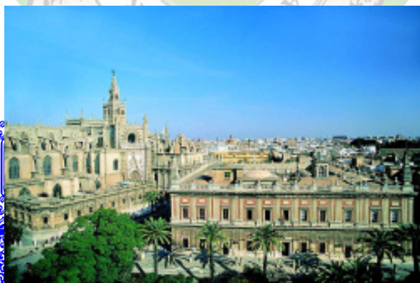
ARCHIVO GENERAL DE INDIAS, DE SEVILLA

LA LABOR DE MECENAZGO EMPRENDIDA POR LOS GÁLVEZ EN ESPAÑA Y EN AMÉRICA SE ENMARCA DENTRO DE LA POLÍTICA GENERAL DE LA ILUSTRACIÓN ESPAÑOLA, DESARROLLADA CON ESPECIAL INTENSIDAD DURANTE LA MONARQUÍA DE CARLOS III (1759-1788). NUMEROSAS CIUDADES ESPAÑOLAS Y AMERICANAS SE BENEFICIARON DE LAS ACTIVIDADES DE LOS COMPONENTES MÁS DESTACADOS DE LA FAMILIA GÁLVEZ, QUIENES OCUPARON ALGUNOS DE LOS PUESTOS MÁS IMPORTANTES E INFLUYENTES DEL ESTADO. ANDALUCÍA FUE UNA DE LAS REGIONES QUE OBTUVO MÁS VENTAJAS, SOBRESALIENDO ESPECIALMENTE MACHARAVIAYA Y MÁLAGA, DONDE HABÍAN NACIDO Y DONDE VIVÍAN FAMILIARES Y AMIGOS, Y SEVILLA, DONDE SE