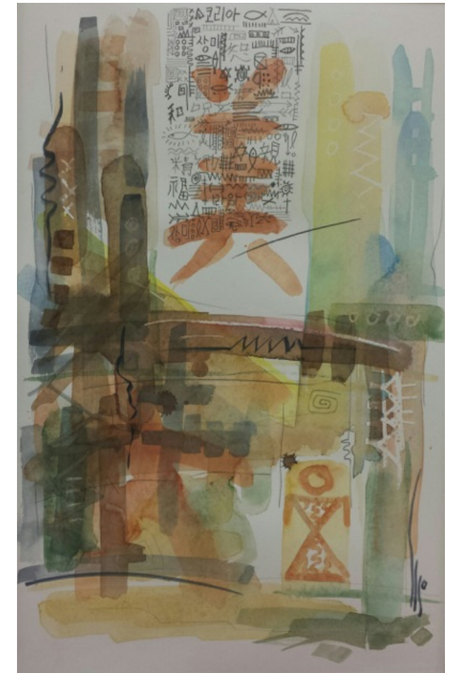
Deseo Femenino, Técnica mixta