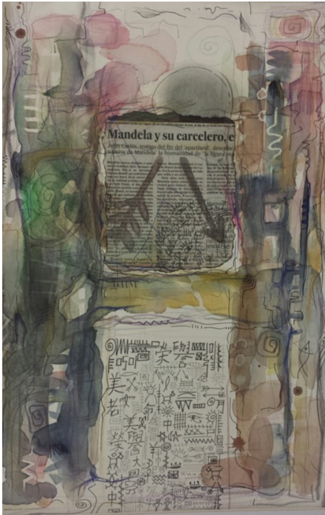
El carcelero es libertad. Técnica mixta

Los acontecimientos que afectan a la humanidad son principalmente mi preocupación temática. Los materiales que utilizo en mi trabajo son básicamente los que no están muy lejos de la naturaleza como el carbón, lápiz, tinta, acuarela y papel. Gracias.