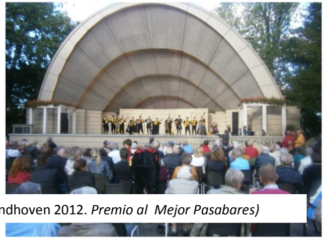
(Tuna Festival Eindhoven 2012. Premio al Mejor Pasabares)