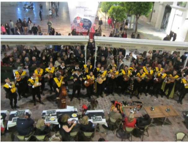
Certamen XL Aniversario Tuna de Medicina de Málaga