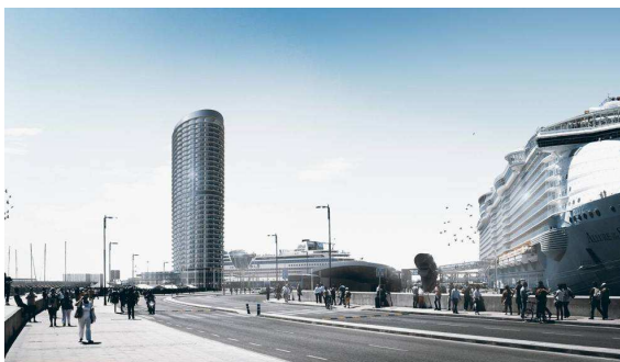
Recreación del hotel proyectado en la Terminal de Cruceros del Puerto de Málaga

Manuel Camacho , Director de Zona para Málaga y Cádiz de Soho Boutique Hoteles: “Una vision práctica de la gestión hotelera”