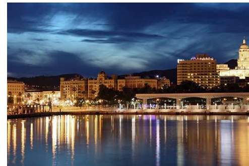
Vista nocturna desde el Puerto de Málaga