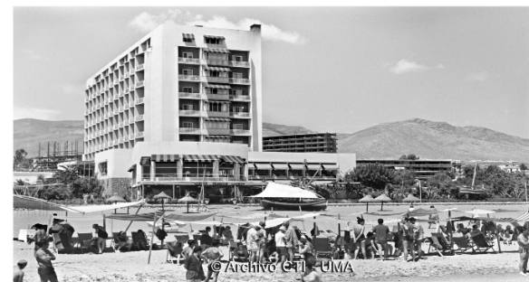
Hotel Pez Espada, años 60.