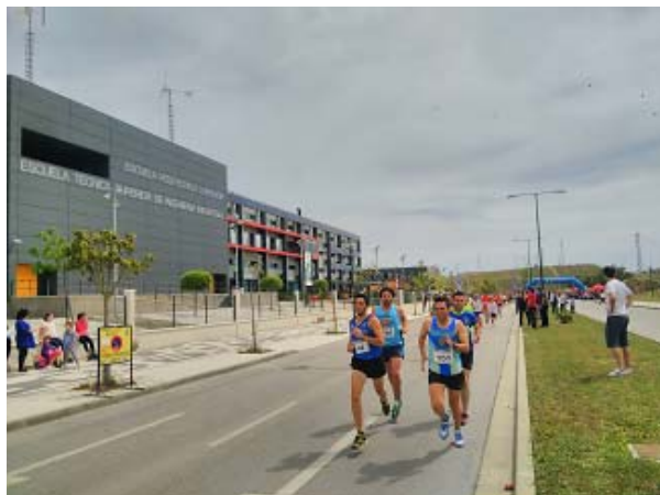
Milla universitaria abril 2015

El precio de la carrera será de 5€ , uno de los cuales irá destinado a la Fundación Uno entre Cien Mil, que lo destinará a la creación de proyectos de investigación para erradicar la leucemia infantil. Las inscripciones se realizarán en www.dorsalesdeportes.elcorteingles.es y en el centro El Corte Inglés Bahía de Málaga. Los dorsales (y la camiseta técnica conmemorativa de la prueba) podrán recogerse días previos a la carrera.