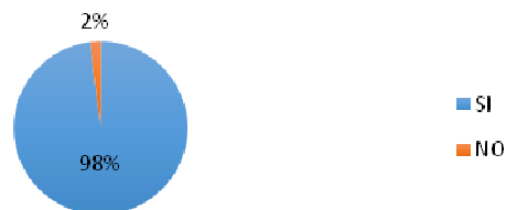
El tutor asignado por la Universidad se interesaba por mi trabajo

Respecto al tutor/a académico de la Universidad, el 98% del alumnado manifiesta estar muy satisfechos/as con ellos. Destacan que los talleres realizados por dichos tutores/as han sido muy interesantes y les han servido de mucha ayuda.