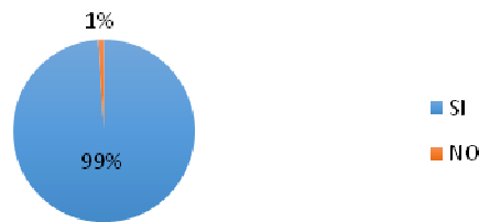
El tutor asignado por la empresa se interesaba por mi trabajo

Para el 99% del alumnado, el tutor/a externo de sus prácticas ha respondido con interés a sus necesidades. En general, los estudiantes manifiestan sentirse muy cómodos con ellos/as y les explicaba satisfactoriamente toda la información proveniente de las tareas que tenían que realizar.