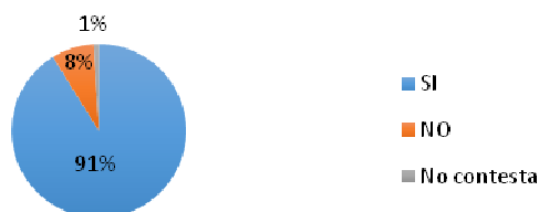
Las líneas de trabajo asignadas en mi proyecto formativo se han cumplido

El 91% del alumnado ha cumplido sus líneas de trabajo asignada a sus proyectos formativos, manifestando con ello que han realizado las tareas para las cuáles fueron formados en el grado, frente al 8% que considera no haber alcanzado este aspecto. Este porcentaje puede responder a aquellos alumnos/as que han desarrollado sus prácticas en centros de carácter muy especializado, cuya formación se dirige más desde las asignaturas optativas cursadas en el segundo semestre de cuarto.