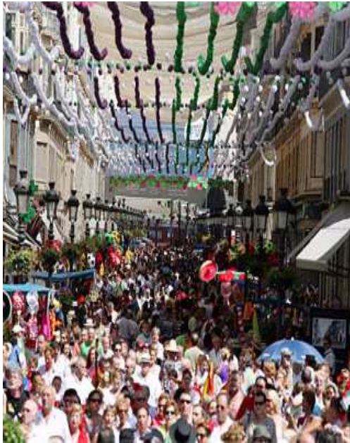
Feria de Málaga. Calle Larios.