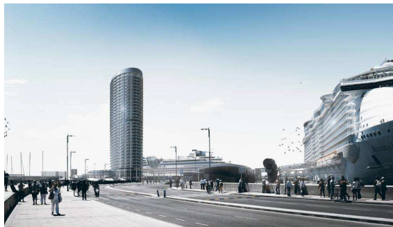
Recreación del hotel proyectado en la Terminal de Cruceros del Puerto de Málaga