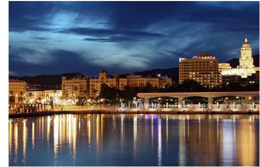
Vista nocturna desde el Puerto de Málaga