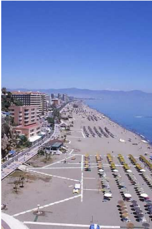
Playa de El Bajondillo (Torremolinos)