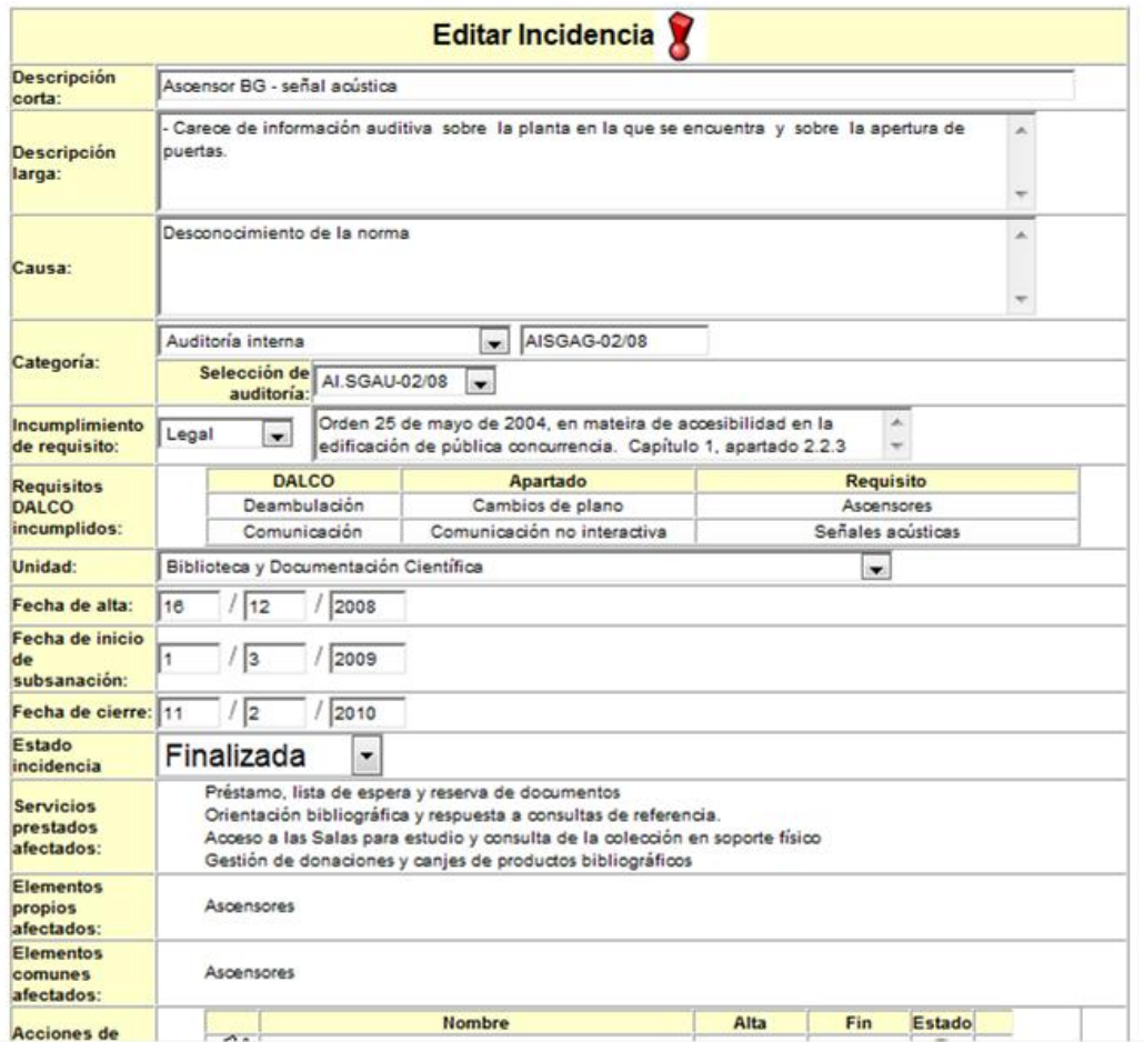
Figura 1. Ficha de incidencia Pegasus

Respecto al estado de las incidencias quizás merezca la pena explicar porqué se desestiman algunas de ellas. Hay que tener en cuenta que nos movemos en entornos ya construidos (en nuestro caso un edificio de 30 años) diseñados sin tener en cuenta criterios de accesibilidad, puesto que en algunos casos se construyeron con anterioridad a la aprobación de las normas legales que les afectan. Las incidencias desestimadas son no conformidades cuya resolución es inviable por el elevado coste de las mismas. Por ejemplo, una de las incidencias que nosotros hemos desestimado, es la que se refiere a dimensión de la huella de la escalera principal (1,5 cm inferior a lo que marca la normativa) y otra se refiere a la dimensión del paso de las puertas del ascensor (5 cm inferiores lo que aconseja la ley, pero por las que cabe perfectamente una silla de ruedas).