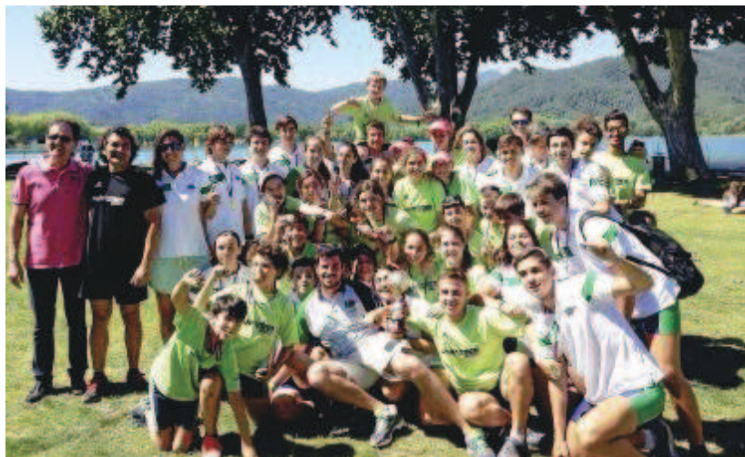
Foto de familia de los integrantes del Club Náutico Sevilla.