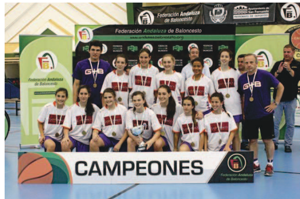
Las chicas del Lo Mónaco posan con sus medallas y el trofeo.

Mientras, en la lucha por la tercera plaza, el CAB Estepona Blanco se impuso claramente al conjunto onubense del CB Conquero por 44-70. Los vencedores apenas dieron opción alguna a sus oponentes.