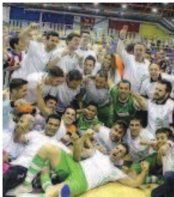
El UMA Antequera festeja su temporada.

Hay que destacar que el conjunto malagueño partía a principios de temporada con el menor presupuesto de la categoría, junto con el equipo que acabó colista, el Sierra Salinas de Villena. Sus jugadores cobran un salario simbólico gracias a la actividad que realizan como monitores de la Academia Red Blue, que cuenta con 180 niños y niñas de todas las edades.