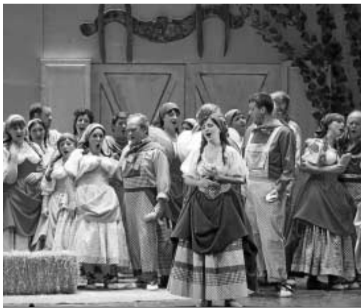
Los ambientes rurales y costumbristas predominan en escena.

Así se manifestó ayer en la presentación Díez Boscovich, quien recordó sus comienzos en la temporada lírica del Cervantes como pianista repetidor y quien definió su lectura de L'elisir d'amore como "limpia, fiel a la idea original de Donizetti en cuanto al discurso