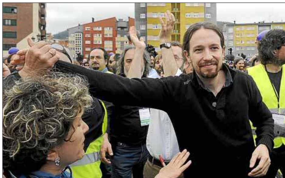
El líder de Podemos, Pablo Iglesias, hizo campaña ayer en Zamora.

También se mostró a favor de reducir la educación concertada a casos «excepcionales» y de impedir que estos centros puedan segregarse por sexos. Asimismo, defendió la necesidad de que la educación infantil de los 0 a los 3 años sea gratuita para que «no sea un privilegio», y abogó por hacerlo «lo antes posible».