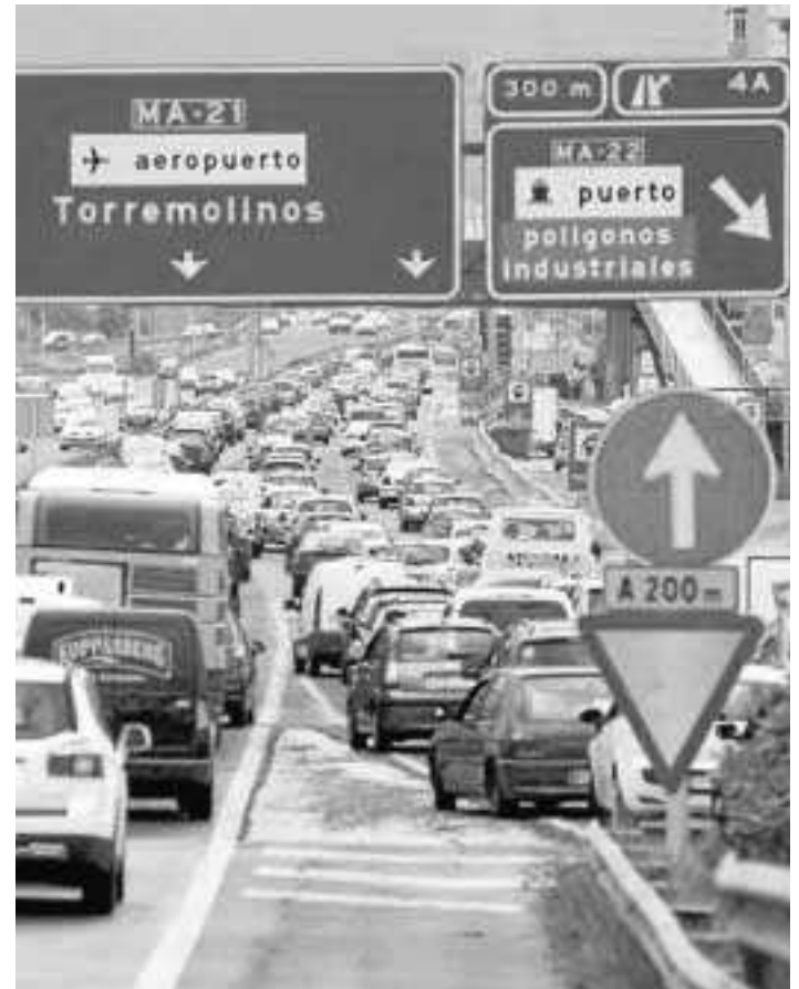
Tráfico colapsado en dirección a Torremolinos.