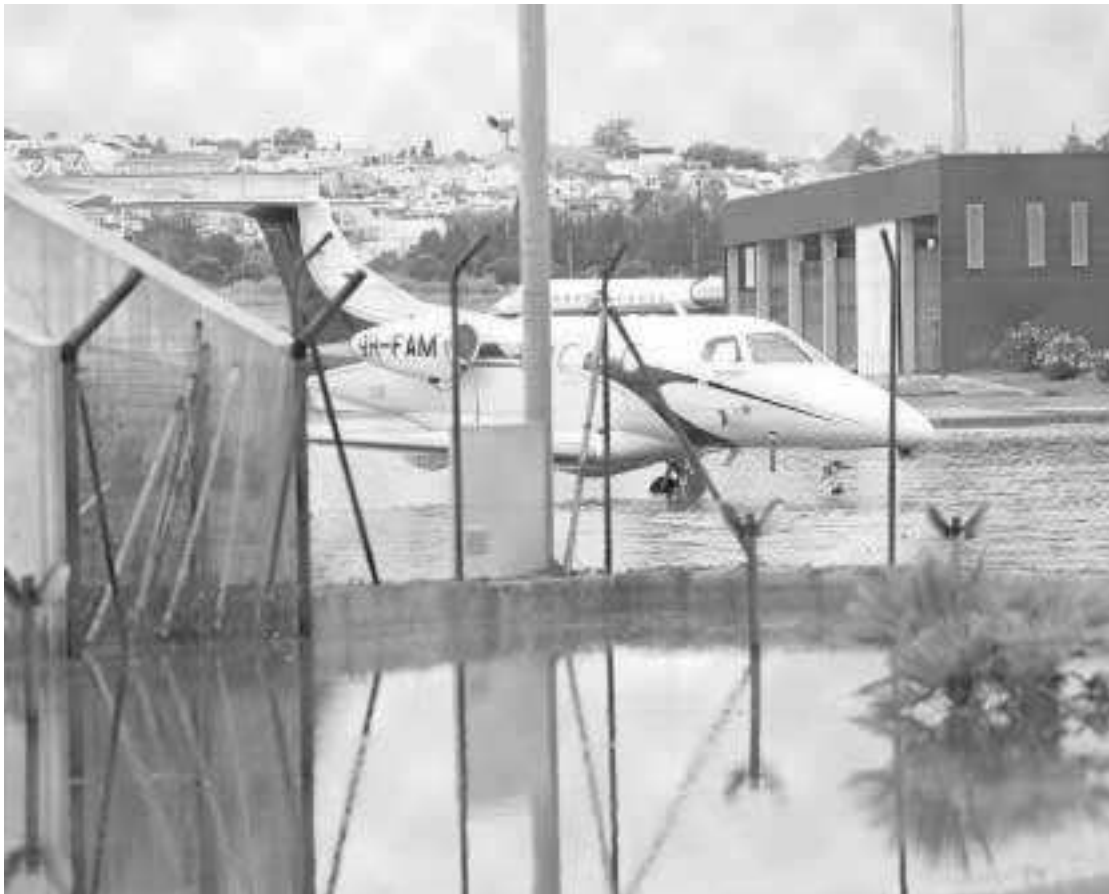
Un avión, ayer, en el aeropuerto de la capital.