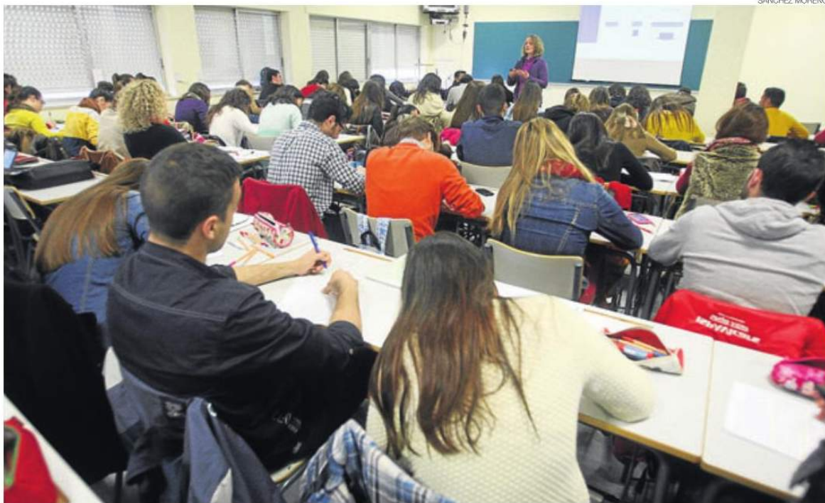
► Alumnos en una clase de la Facultad de Ciencias de la Educación de Córdoba.

Según la información facilitada por la UCO, el curso lectivo que ahora se inicia se prolongará hasta el 3 de junio, oficialmente, aunque cada facultad y cada grado concluirá sus clases de acuerdo con su propio calendario cuatrimestral y su periodo de exámenes. Las fechas fijadas por la UCO para cada cuatrimestre son del 9 de septiembre al 18 de diciembre para el primero; y del 15 de febrero al 3 de junio para el segundo. Así, desde hoy se ponen en marcha todos los centros, excepto de los de Belmez, para los cursos de segundo en