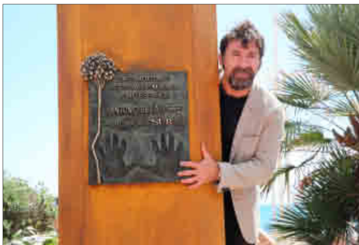
Antonio de la Torre, durante el último Festival de Málaga.

Para ello, se interpretarán temas desde Sabina a Alejandro Sanz,