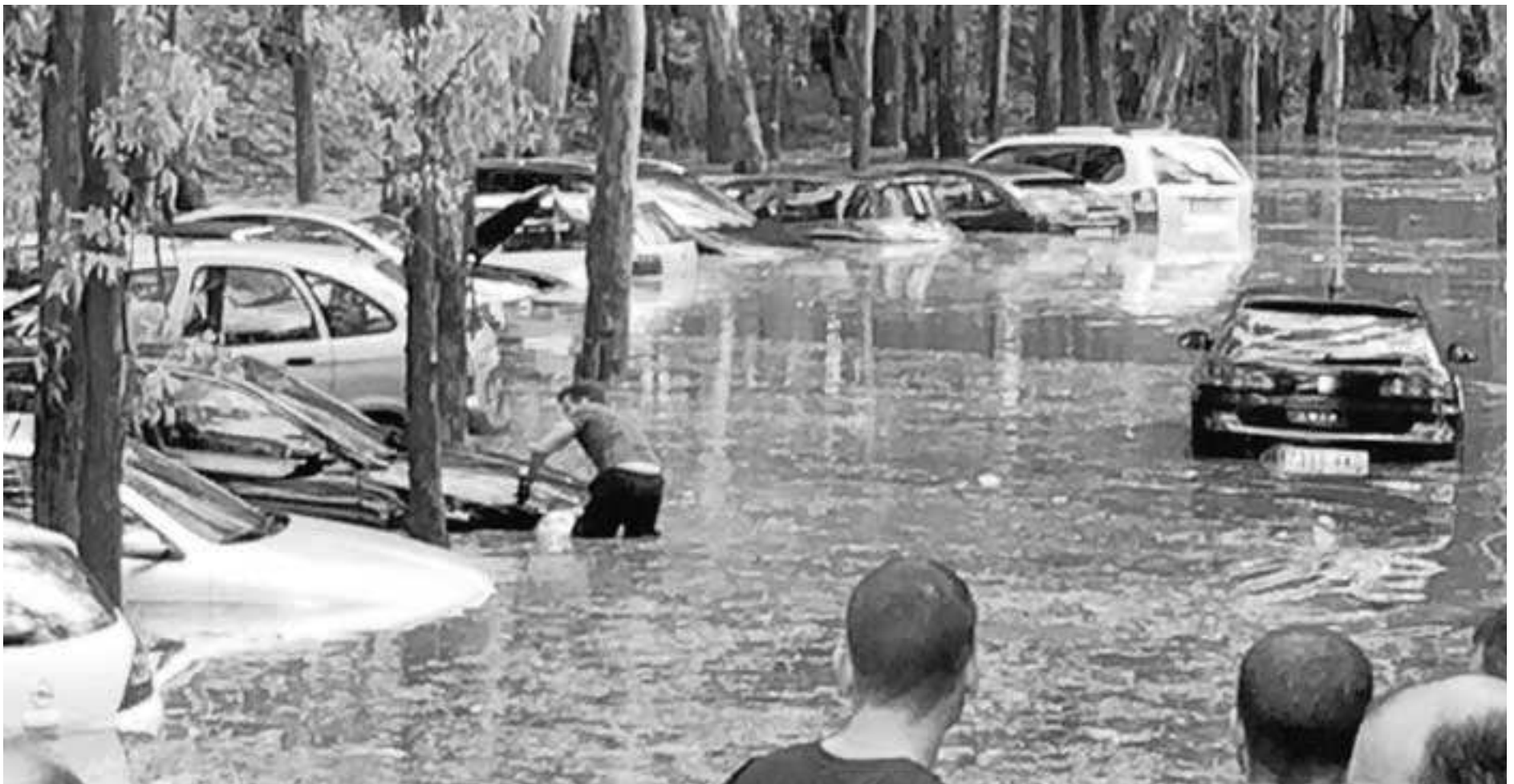
Trabajadores de un concesionario, ayer, tratando de sacar sus vehículos sumergidos en un descampado cerca del aeropuerto.

● Varias trombas de agua dan lugar a casi un centenar de avisos por anegaciones, desprendimientos y carreteras cortadas ● Un colegio de Alhaurín de la Torre se inundó