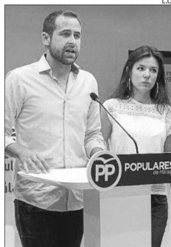
Verde, ayer, en rueda de prensa.

En concreto, la partida que transfiere el Gobierno andaluz a la UMA en concepto de becas y ayuda social ha pasado de 625.000 a 450.000 euros. «Si a esto le añadimos que actualmente la Junta adeuda a esta universidad 103,7 millones de euros, la verdad es que la implicación de la Administración andaluza con el ámbito uni-