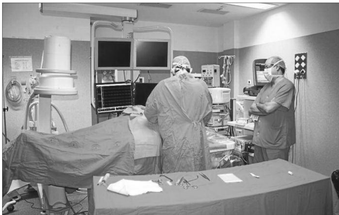
Cirujanos en una intervención cardiaca en quirófano.