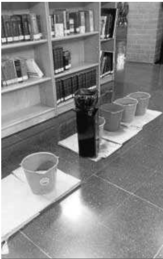
Cubos de agua, en la Biblioteca de la UMA.