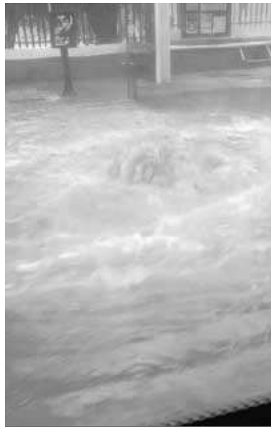
Acera del IES La Rosaleda, frente al campo de fútbol.