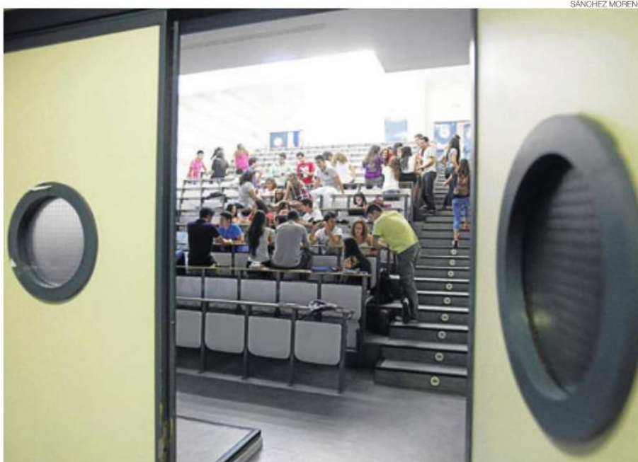
► Una clase del campus universitario de Rabanales.

En concreto, en Andalucía se mantiene por tercer año consecutivo en todas las titulaciones el precio por crédito, que se sitúa en 12,62 euros, y en el caso de los másteres que habilitan para el ejercicio de actividades profesionales reguladas en España la tarifa se sitúa en 13,68 euros. Además, se da la circunstancia de