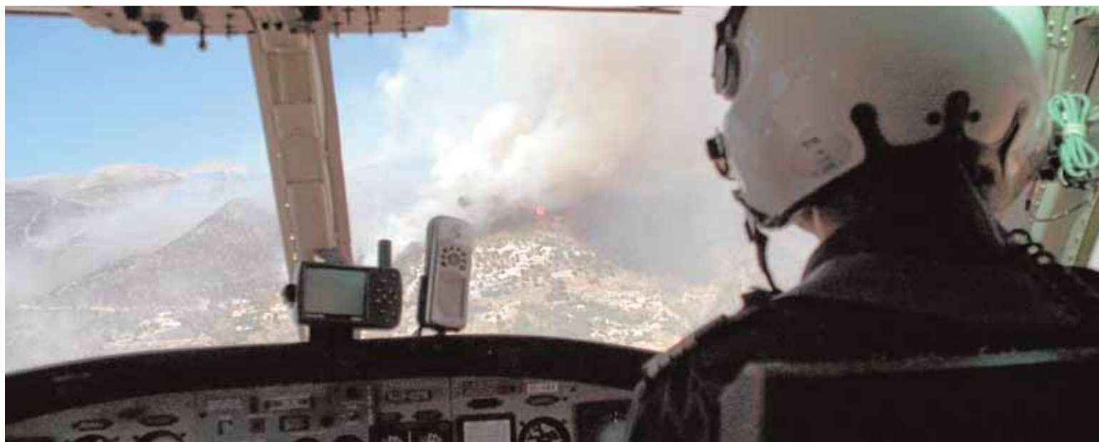
La brigada de élite luchó contra el fuego de Cómpea que arrasó 200 hectáreas el pasado año. :: SUR