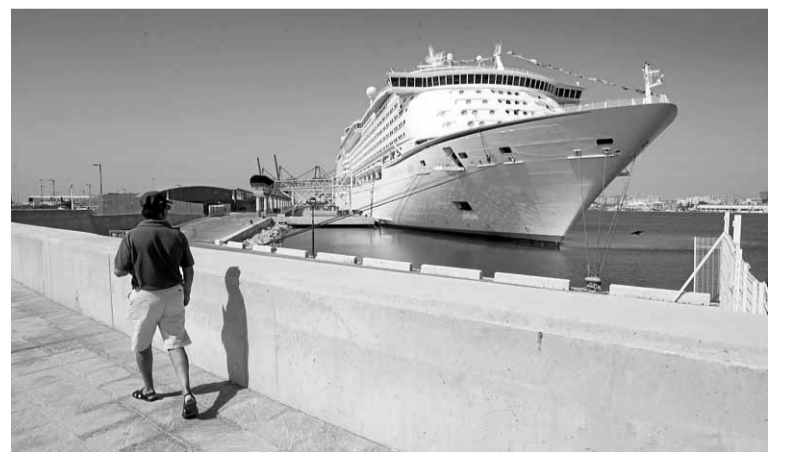
Terminal de cruceros del puerto de Málaga. :: SUR

Con esta buena trayectoria desembarca el puerto de Málaga en la Seatrade Europe, que se celebra desde mañana en Hamburgo. A esta cita acude de la mano de la Junta de Andalucía, el Ayuntamiento de Málaga, Turismo Costa del Sol y Cruceros Málaga. El evento, que congre-