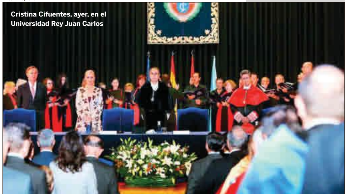
Cristina Cifuentes, ayer, en el Universidad Rey Juan Carlos

matriculados, y la variable –cuyos criterios quedarán establecidos en la elaboración de la ley– se repartirá en función de los resultados de cada centro en investigación o transferencia de conocimiento.