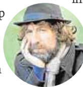
Antonio de la Torre

Para ello, se interpretarán temas desde Sabina a Alejandro Sanz, Raphael, Serrat, Mecano o Miguel Bosé. Pero 'Desnúdame el alma' no es