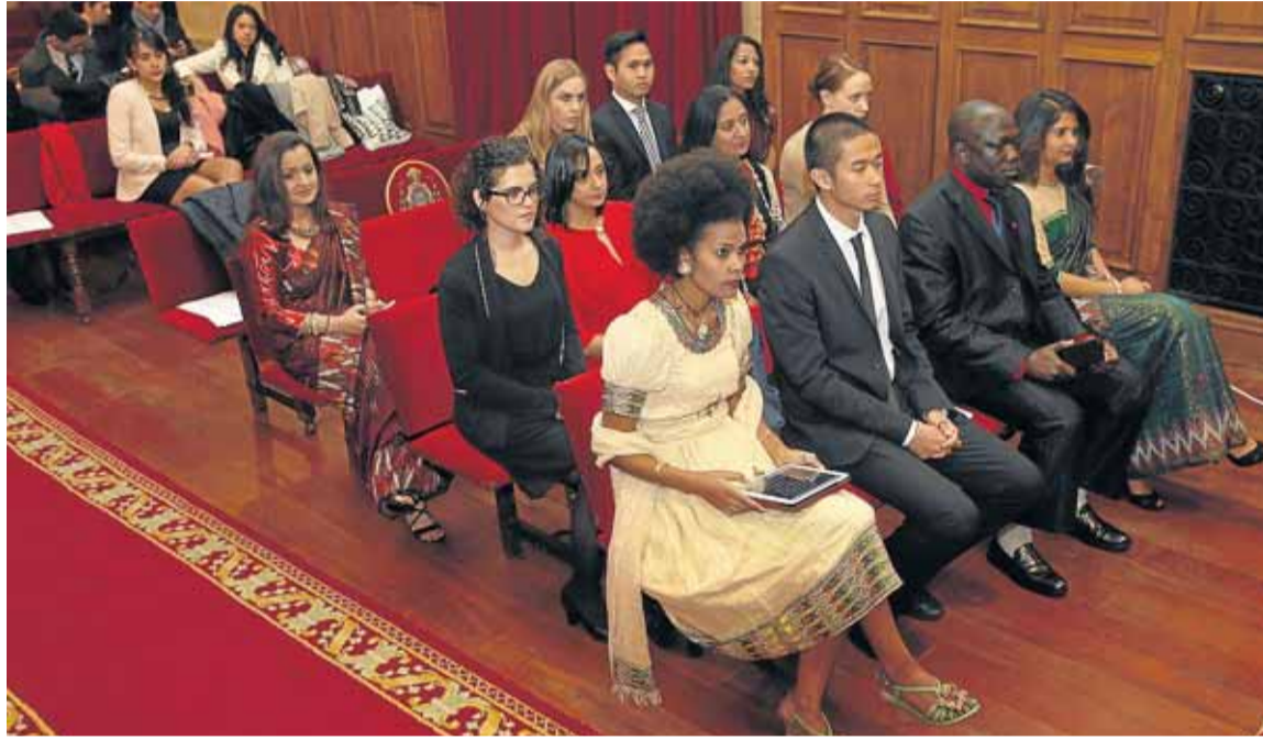
Entrega de diplomas del Erasmus Mundus en Enfermería de Urgencias a alumnos de nueve nacionalidades, el curso pasado.

Pero los acuerdos internacionales no son solo para intercambiar alumnos (en los últimos dos cursos ha habido unas 70 plazas en universidades de todo el mundo). También los hay para llevar a cabo proyectos de colaboración académica, cientí-