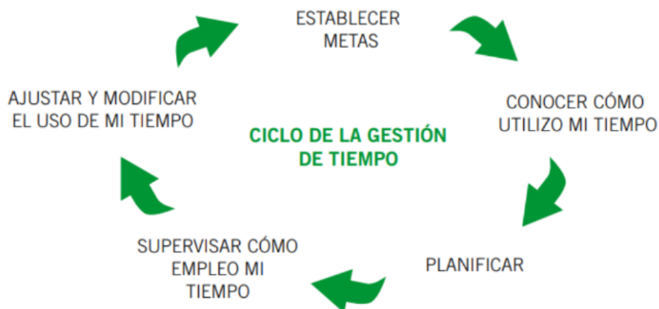
Figura 1. Ciclo de gestión del tiempo.

Básicamente se basa en ver los objetivos: (1) los métodos que usamos para gestionarlo (2) y su posterior planificación (3). Después iremos analizando cómo ha evolucionado (4), si hemos logrado lo que queríamos, si tenemos brechas de tiempo, etc. Finalmente reajustamos nuestro plan de acción.