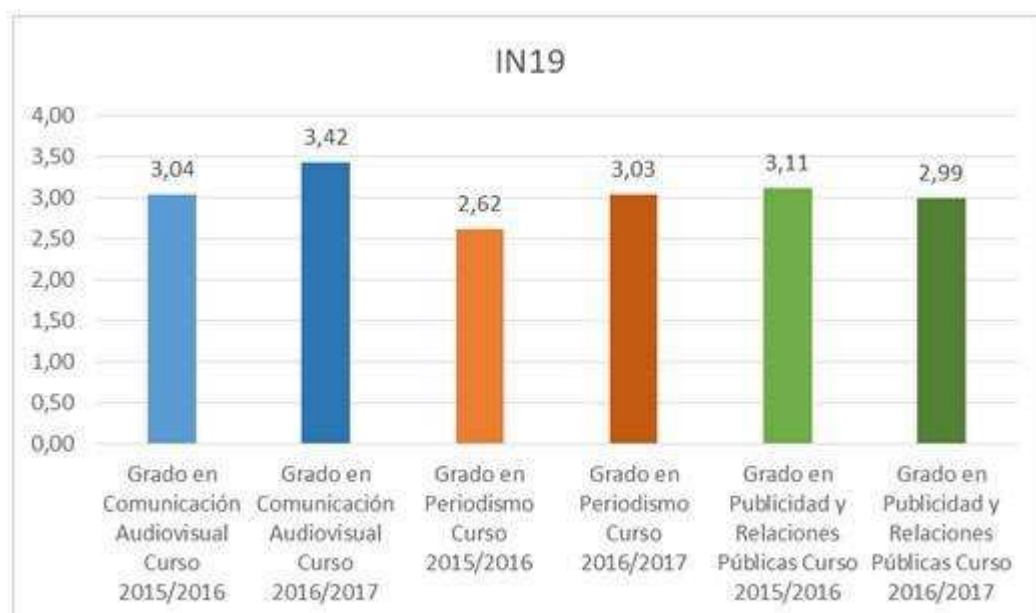
Gráfico 1. Nivel de satisfacción de los estudiantes -Proceso de selección, admisión y matriculación-