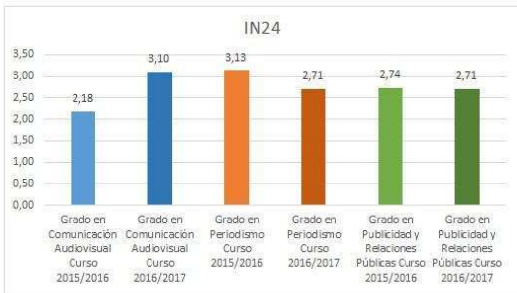
Gráfico 2. Nivel de satisfacción de los estudiantes -Actividades de orientación-