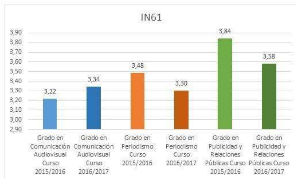
Gráfico 5. Nivel de satisfacción de los usuarios -Servicios del centro-