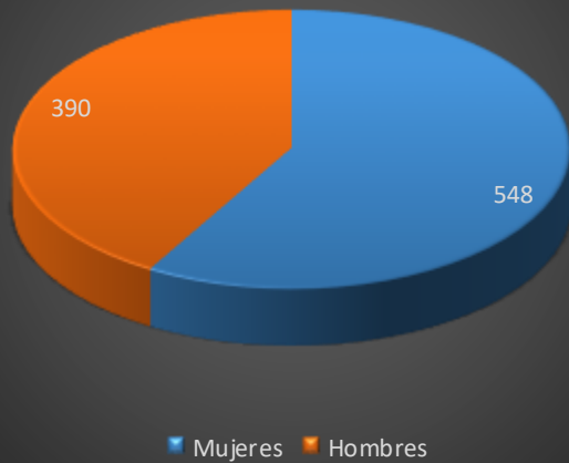
Tratamiento por genero