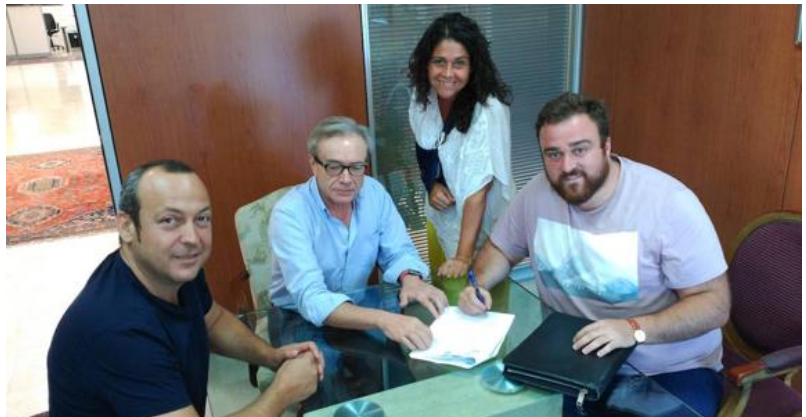
Directivos de ambos clubes sellan la unión.

Un paso más hacia la profesionalización del Trocadero Marbella Rugby Club. La entidad selló el miércoles ante notario un importante convenio de