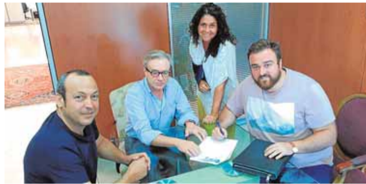
Directivos de ambos clubes sellan la unión.

ga repiten convocatoria con el combinado de su país, tras acudir a la pasada Copa América Centenaria, disputada en Estados Unidos. No fue una cita muy afortunada para la mayoría de ellos, con la lesión temprana de Rosales, el único que fue titular, y la poca confianza de que gozaron Mikel y Juanpi. El duelo en Colombia será el 1 de septiembre, a las 22.30, y el choque en casa ante Argentina, la madrugada del 7 (2.00).