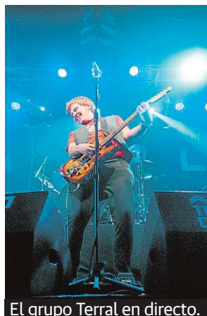
El grupo Terral en directo.

El pasillo artístico ubicado en la Facultad de Ciencias de la Comunicación (calle León Tolstoi, 4) se despide del año con una nueva muestra. 'Sobre el escena-