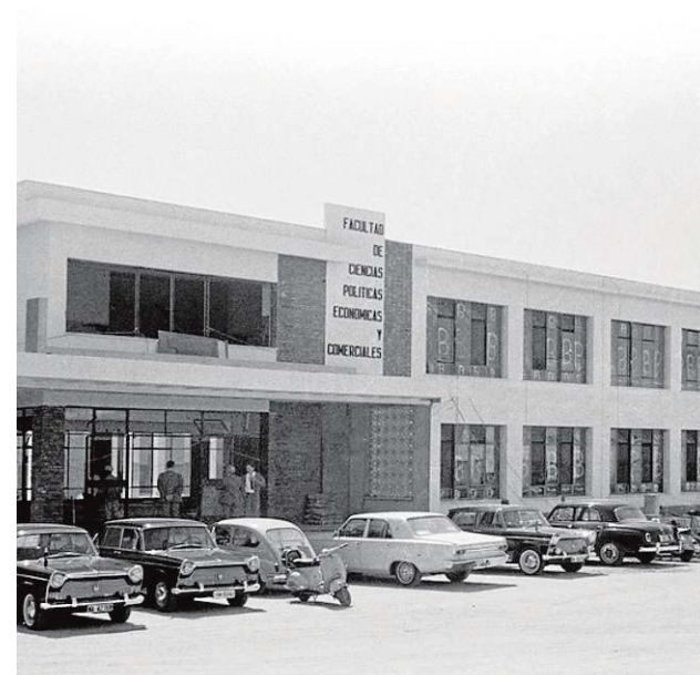
La Facultad de Económicas en el año 1967.

Durante la visita a la exposición también se podrá ver una maqueta del primer edificio diseñado para la facultad y una docena de fotografías sacadas del Fondo Bienvenido-Arenas, perteneciente al archivo fotográfico del Centro de Tecnología de la Imagen (CTI)-Universidad de Málaga (UMA). La muestra está abierta de lunes a viernes, de 11.00 a 14.00 y de 17.00 a 20.00 horas; y los sábados, domingos y festivos, de 17.00 a 20.00 horas.