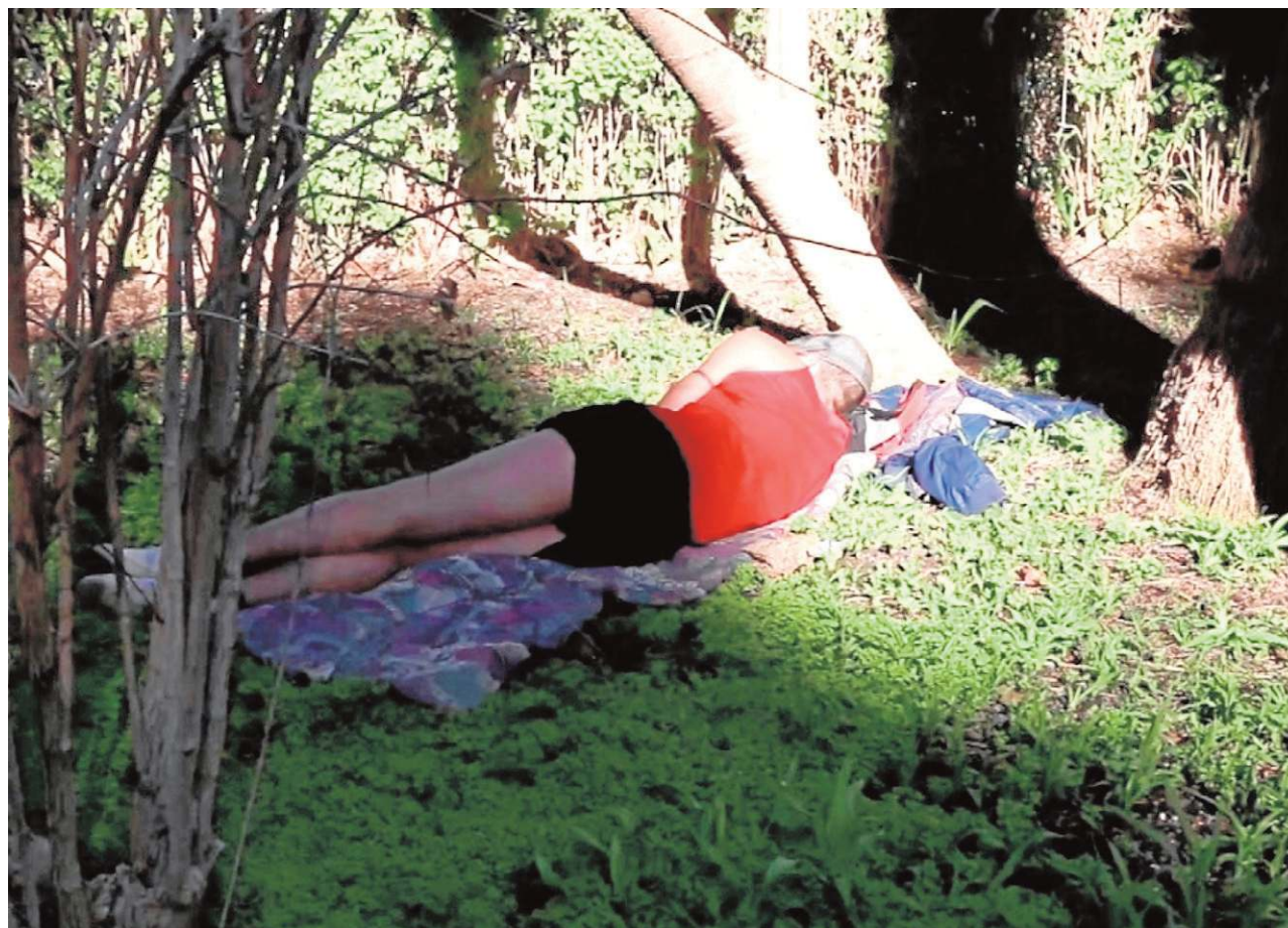
Captura de pantalla de uno de los sugerentes vídeos, donde aparece un hombre solo en el Paseo del Parque.