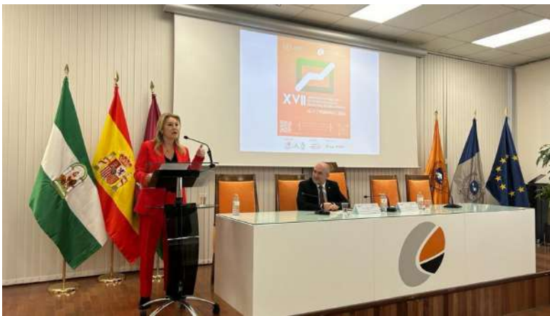
Carolina España, consejera de Economía, Hacienda y Fondos Europeos.