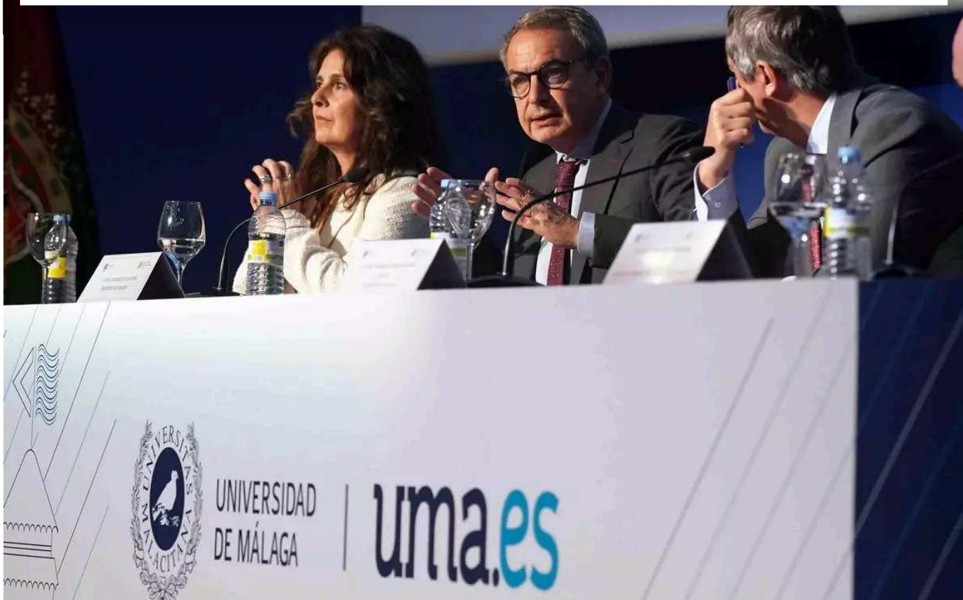
Zapatero, junto al rector Teo López en la conferencia.

Mientras salía y entraba a la cuestión catalana, Zapatero salpicó sus respuestas de algunas de sus experiencias como gobernante: “Recibí críticas muy duras cuando impulsé el matrimonio homosexual. No creía que había tantos obispos hasta que la Iglesia organizó aquella manifestación. Y, unos años después, un dirigente del PP se casa en Vitoria -Maroto que ahora está en el Senado- y allí estaba Rajoy bailando y celebrando el matrimonio homosexual, fue una gran satisfacción”.