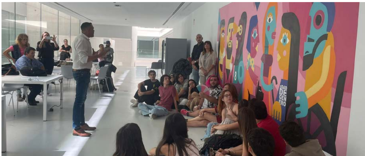
Foto de la inauguración del mural de la diversidad