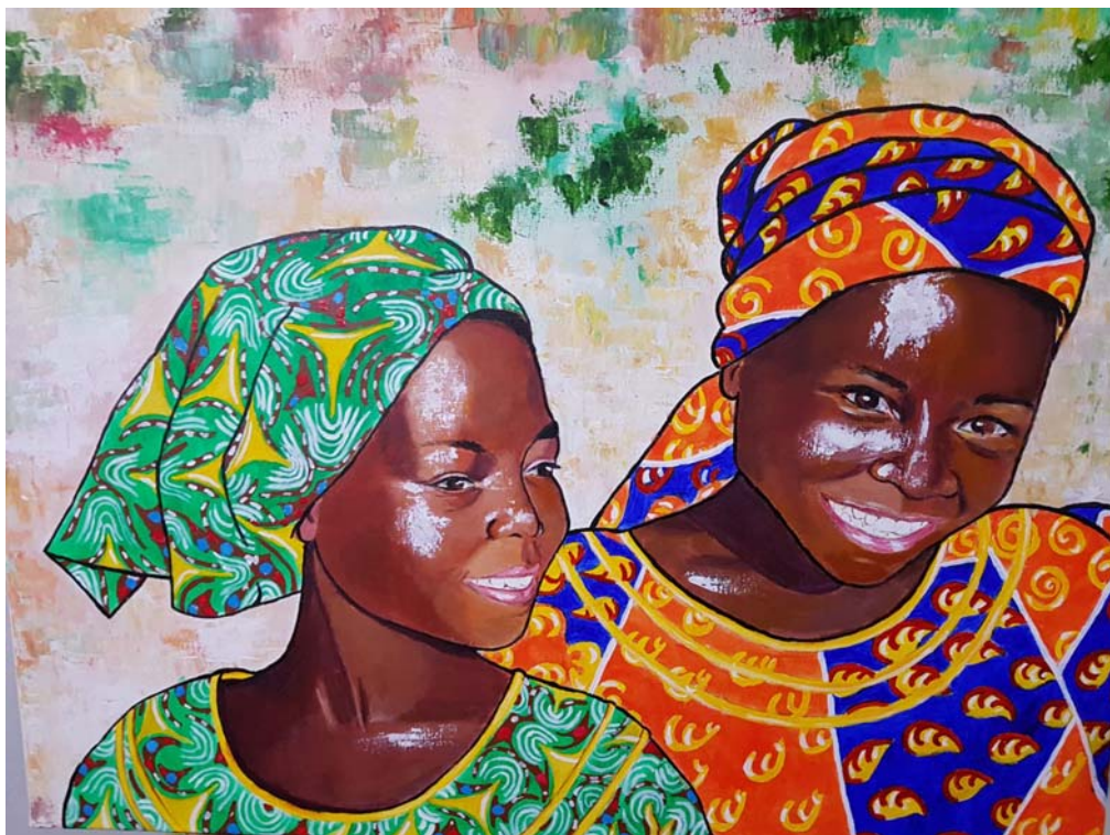
INOCENCIA DE SAL Acrílico sobre lienzo Medidas :73 x60 Autor: Lola Gil