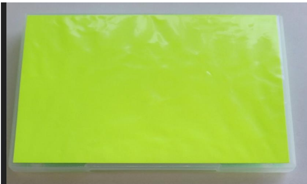
Imagen 1: Pieza color 1

Su forma es rectangular y disponen de un color distinto en cada una de sus caras. Todas las piezas tienen una zona imantada en los laterales para que puedan unirse unas con otras. Además cada pieza tiene una arandela central que sirve de contrapeso para que no se vuele con el viento, teniendo en cuenta que su uso se realizará al aire libre. Es por este motivo también que el material es plástico para que sea impermeable, aprovechando este material poco pesado para poder ser transportado fácilmente cada pieza o todas las piezas de la dinámica (imágenes 1, 2 y 3).