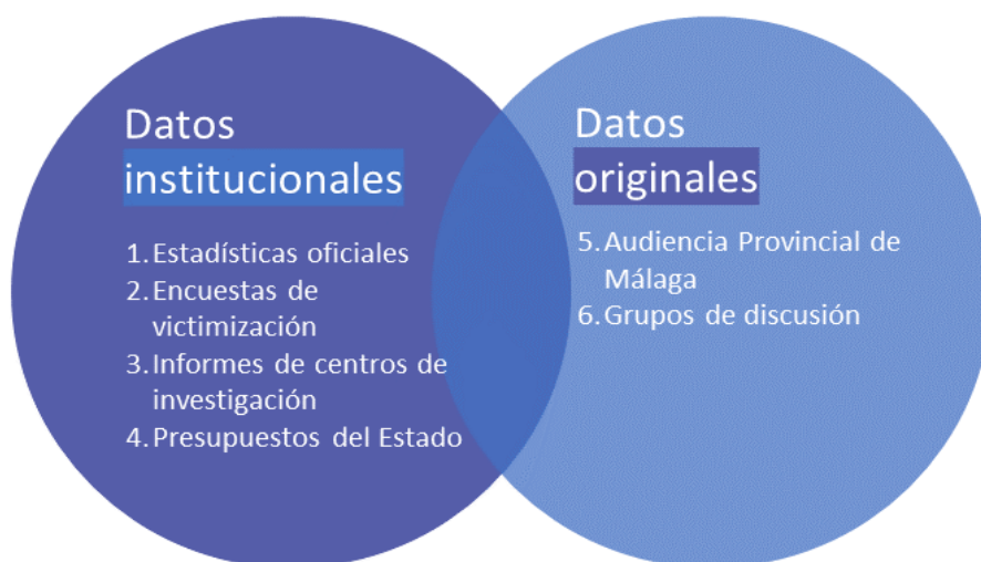
Gráfico 1. Fuentes de datos utilizadas

Pueden observarse, en el Gráfico 2 , los datos institucionales utilizados y las secuencias temporales analizadas en este trabajo.