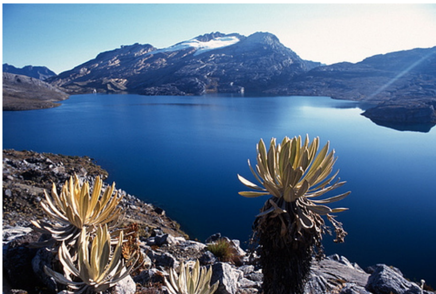
Parque Nacional Natural El Cocuy