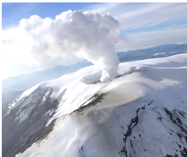
Parque Nacional Natural Los Nevados

“ Brindar el conocimiento de la realidad ambiental colombiana, así como del análisis de las herramientas jurídicas nacionales y extranjeras para su protección y uso razonable.