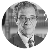
César Alierta PRESIDENTE DE TELEFÓNICA

Cofundador de Geeksphone, que fue la primera empresa europea en crear un terminal con el sistema Android de Google. Premio Empresa de la Fundación Princesa de Girona 2012.