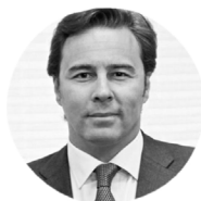
Dimas Gimeno PRESIDENTE DE EL CORTE INGLÉS

Es especialista en Desarrollo Organizacional con más de 20 años de experiencia en organizaciones internacionales. Economista y experta en Desarrollo Organizacional.