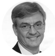
Fernando Ruiz PRESIDENTE DE DELOITTE ESPAÑA

Es director general de Google para España y Portugal y cofundador del Instituto Superior para el Desarrollo de Internet (ISDI).