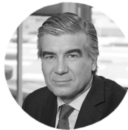
Francisco Reynés PRESIDENTE EJECUTIVO DE NATURGY

* Los cargos y CV corresponden al momento de su participación