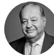
Carlos Slim PRESIDENTE DE LA FUNDACIÓN CARLOS SLIM

Es profesor Investigador ICREA en el Instituto de Bioingeniería de Cataluña. Obtuvo el Récord Guinness al "jet más pequeño creado por el hombre". En 2015 obtuvo el Premio Princesa de Girona a la Investigación Científica.