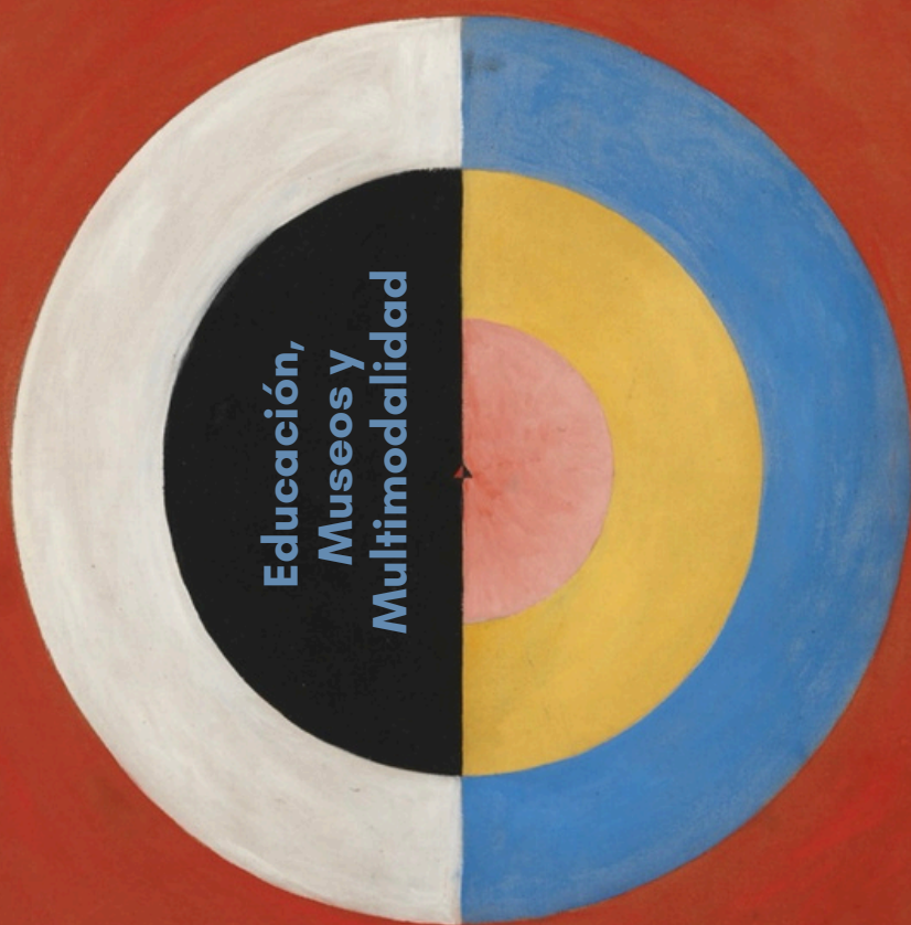
Hilma af Klint, The Swan, no. 17. Moderna Museet, Estocolmo, Suecia