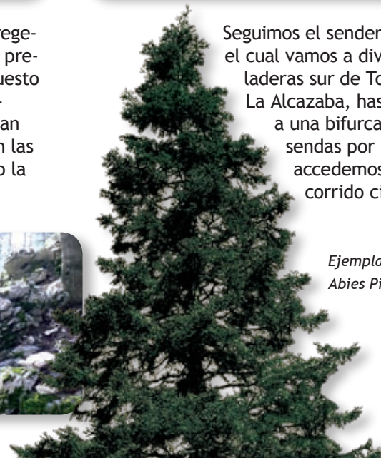
Ejemplar de Abies Pinsapo

Si tomamos el camino de la derecha, subiremos por el cortafuegos en dirección a otro pinsapo, el de Puntal de la Mesa, con un porte tan majestuoso que puede emular al anterior, aunque su copa redonda, poco habitual en este tipo de abetos, lo singulariza. Pasado este longevo árbol nos adentramos en una zona incendiada en 1991 y continuando unos cuantos metros a media ladera por el barranco del Hinojar disfrutaremos con las impresionantes vistas [4] del paisaje abierto a nuestros pies: Cerro Abanto, Sierra Palmitera, Sierra Real y el valle del río Verde. De vuelta al carril, el recorrido de retorno deberá hacerse sobre el mismo trayecto, que constituye la única vía de uso público de la zona.