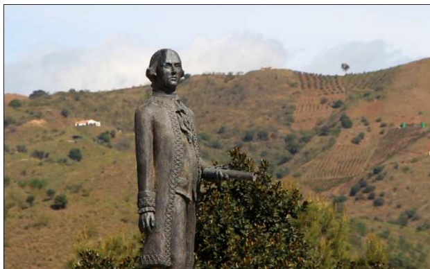
Estatua de Bernardo de Gálvez en su villa natal Macharaviaya

Para este año el Aula María Zambrano de Estudios Transatlánticos está programando el II Workshop , para los días 16 y 17 de junio, y cuyo eje conductor del encuentro de este año se configura en torno a la Familia Gálvez y especialmente en la figura universal de Bernardo de Gálvez .