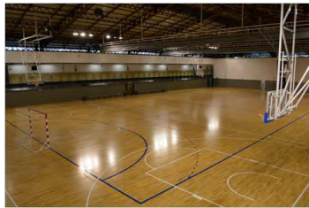
Pabellón Multifuncional C.Educativo Deportivo Pirotecnia