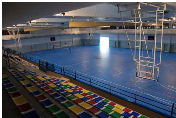
Pabellón Multifuncional C.D. Universitario Los Bermejales

Dimensiones: 51 mts X 32 mts. Pavimento: Madera flotante. JUNKERS UNO BAT 62. Equipamiento: Canastas a techo MONDOHANGER. Marcadores.