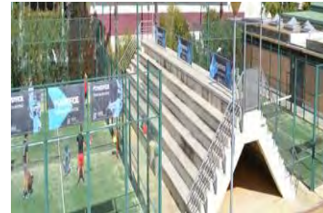
Pistas Padel C.D.U. Los Bermejales

Específicas para competición, ya que sus paredes están formadas por cristales templados de 12 mm. Una superficie de césped artificial de última generación monofilamento de la prestigiosa firma MONDO