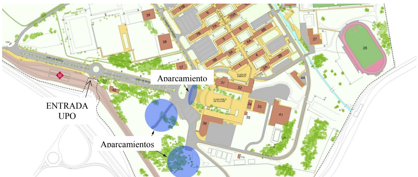
PLANO GENERAL DE LA UNIVERSIDAD "PABLO DE OLAVIDE".