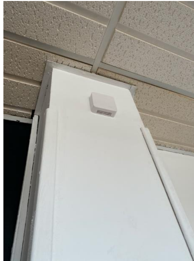
Figura 1. Medidor de CO2