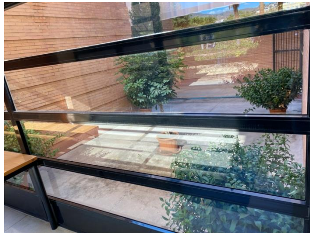
Figura 8. Plantas decoración pasaje edificio y Sala de Grados