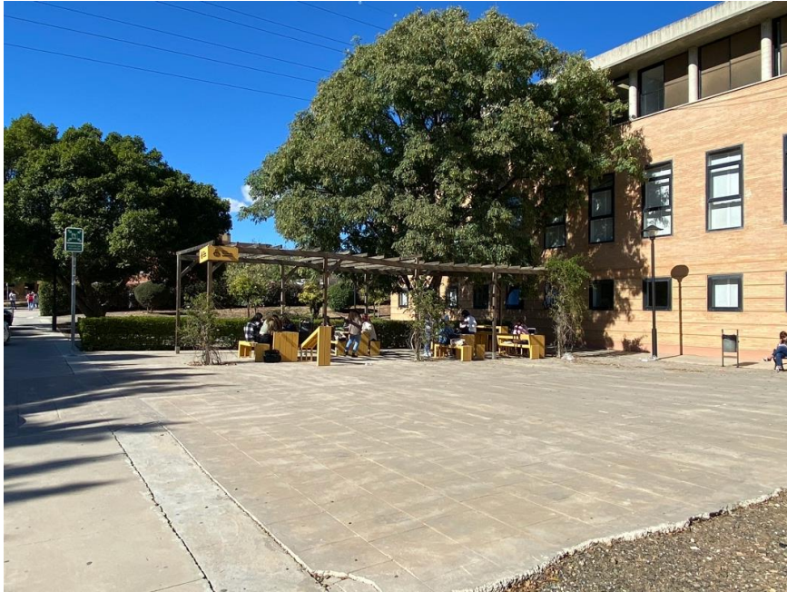
Figura 10. Nuevo mobiliario exterior accesible zona trasera del edificio