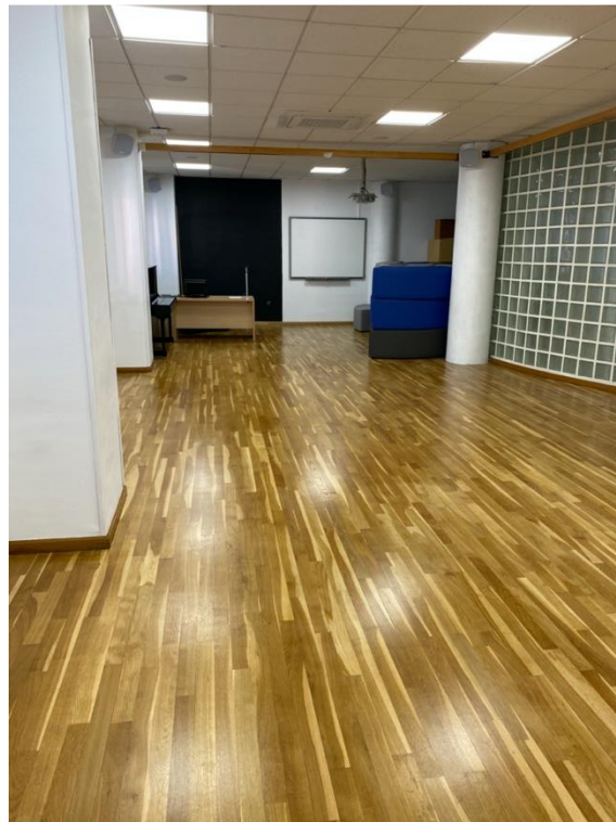
Figura 11. Renovación aula 1.17