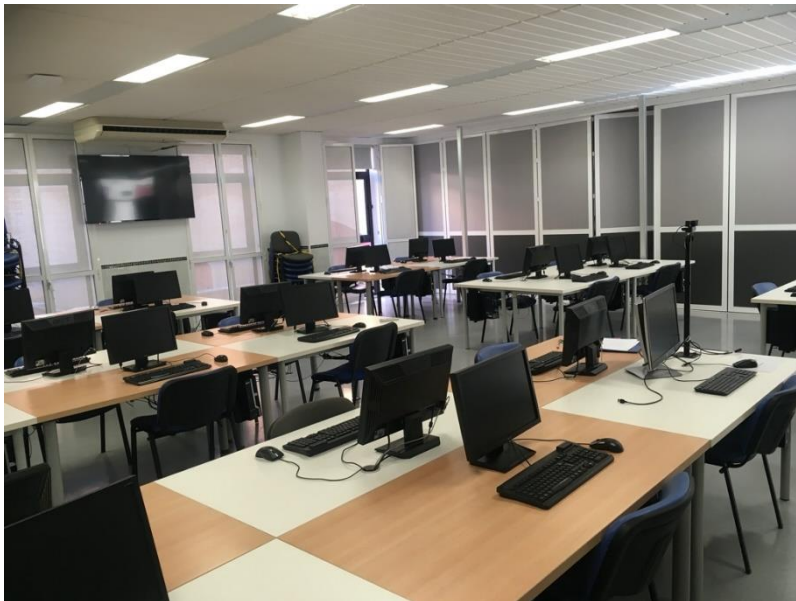
Figura 6. Instalación de pantallas de refuerzo aulas TIC 1.01 y 1.02