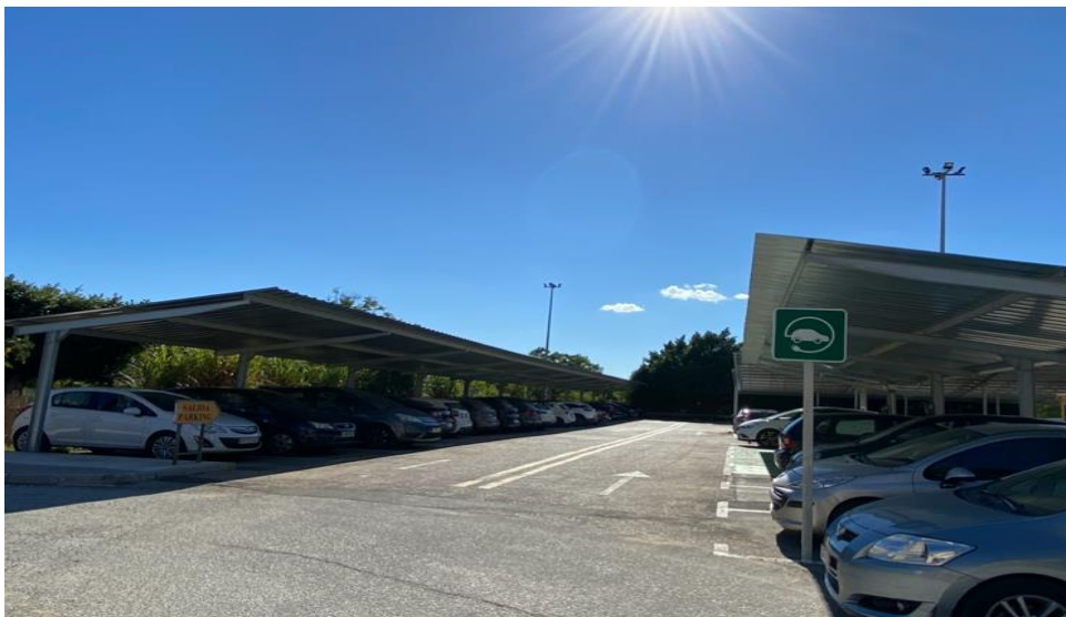
Figura 2. Paneles solares en el parking