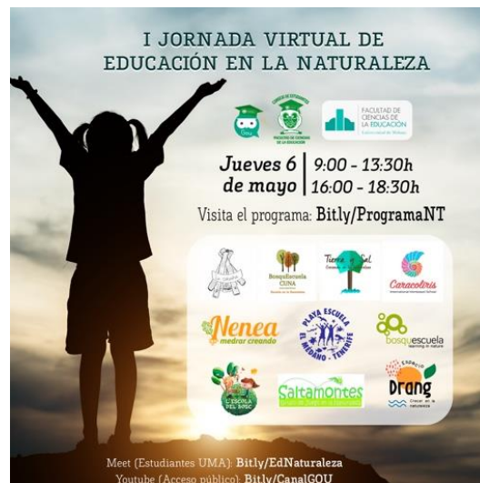
Figura 15. Cartel I Jornada Virtual de Educación en la Naturaleza