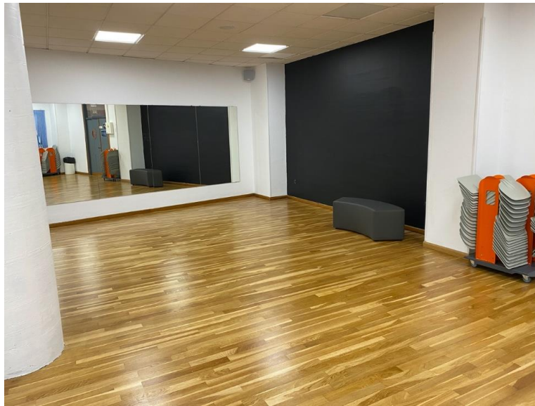
Figura 12. Renovación aula 1.17