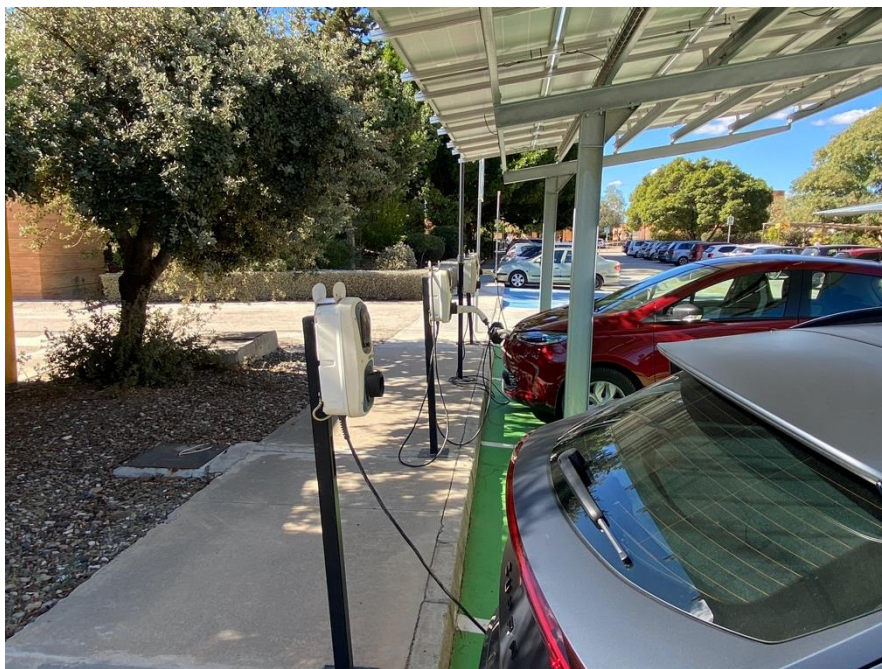
Figura 4. Cargadores para vehículos eléctricos parking