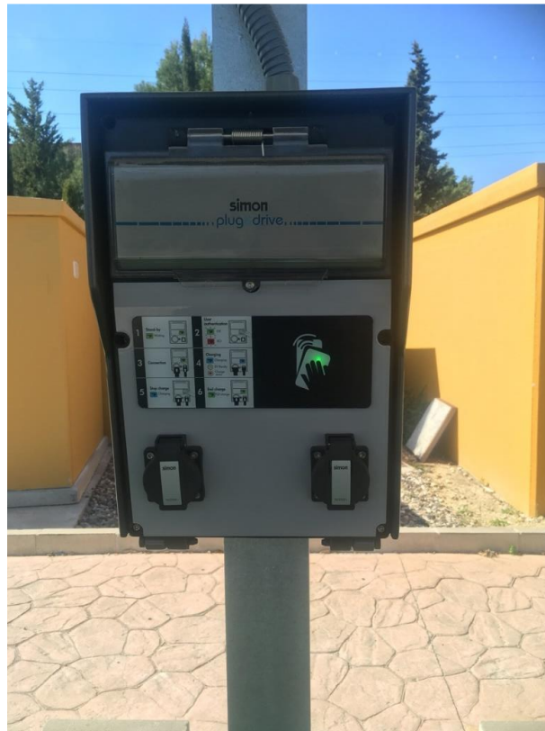
Figura 5. Cargador para vehículos eléctricos parking