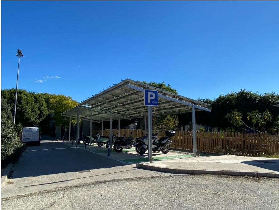
Figura 3. Paneles solares parking de motocicletas