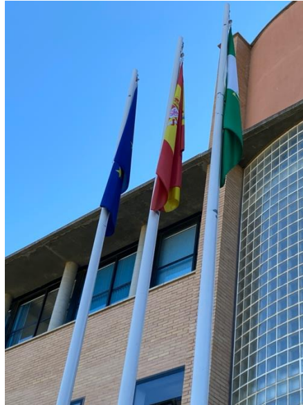
Figura 7. Renovación banderas oficiales y cuerdas