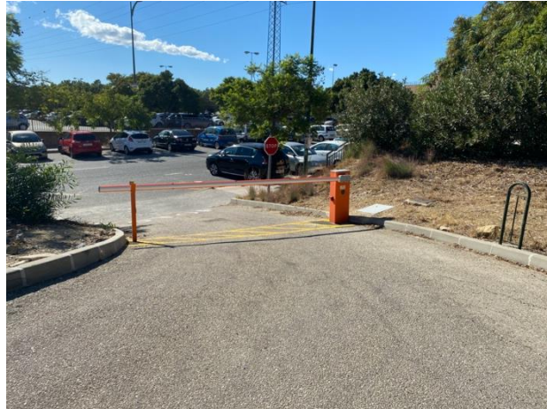
Figura 9. Arreglo barrera parking