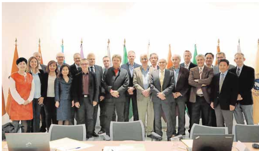
Expertos que debaten sobre la hepatotoxicidad en el Rectorado de la Universidad de Málaga.