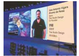
Anuncio del premio.

En nombre de los examinadores, Francisco Fernández, explicó que la culpa de todo lo que está pasando es de la DGT, ya que no reconoce aspectos como la peligrosidad de su trabajo. Igualmente cifró en 250 euros bruto al mes las diferencias económicas con el Estado. «Entendemos el daño que se está produciendo, pero este es nuestro derecho y la responsabilidad sólo es de la DGT», resumió.