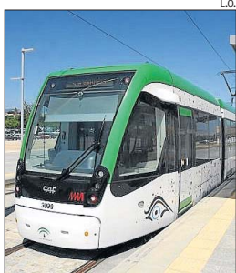
Imagen del metro.

Francisco Fernández, de la citada plataforma, recordó que piden que se cumpla lo firmado por el Ejecutivo andaluz en el punto tres del protocolo de intenciones de 2013, además de lo comprometido por la presidenta de la Junta, Susana Díaz, y también lo que se aprobó en el pasado pleno del Ayuntamiento del 30 de octubre.