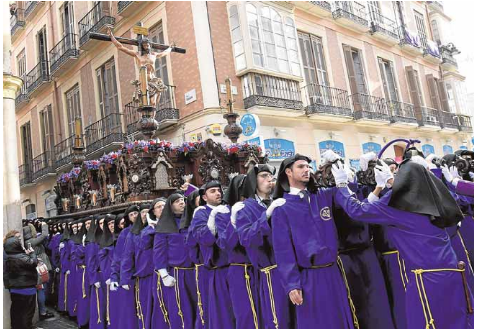
El Cristo de la Crucifixión podría presidir el vía crucis de la Agrupación de Cofradías. :: sur

Otras hermandades que ya han confirmado sus respectivas procesiones extraordinarias son las del Santo Traslado, con la Virgen de la Soledad de San Pablo con motivo del centenario de la cofradía, y la Pollinica, por el 75.º aniversario