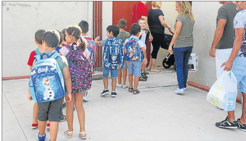
Alumnos de Primaria vuelven a clase después de las vacaciones de verano.