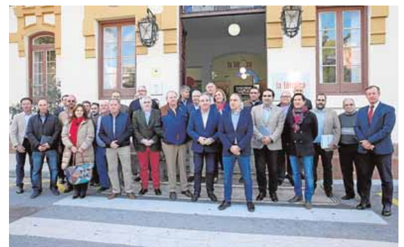
Miembros de la mesa del agua creada por el PP.

«Se trata de un tema detrás del cual hay mucha economía, empleo y puestos de trabajo, y tenemos que empezar a buscar soluciones por si