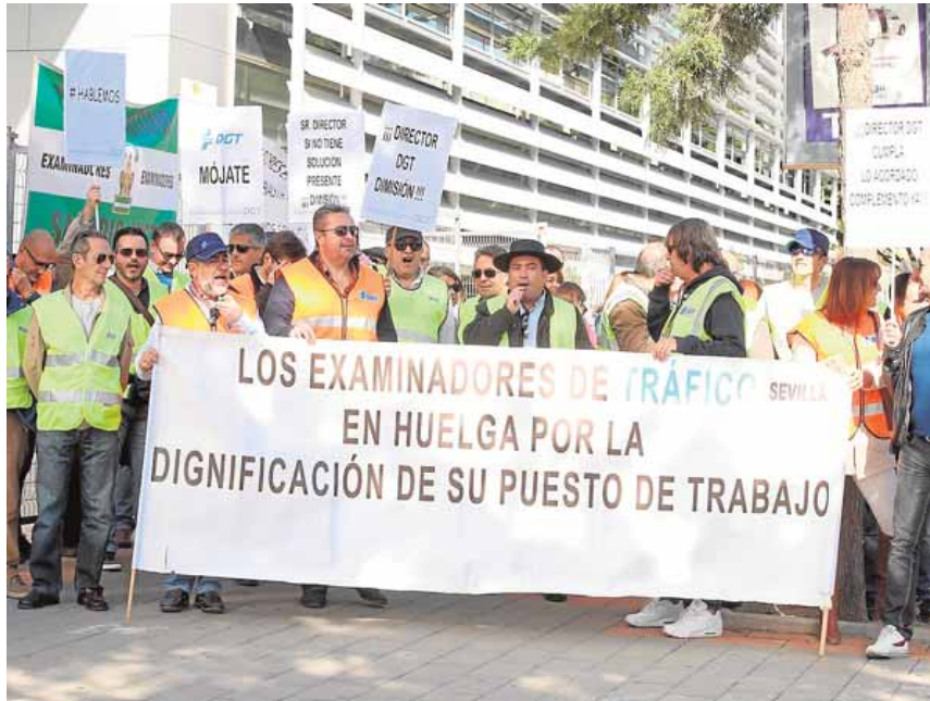
Examinadores de toda Andalucía se concentraron ayer en Málaga.

Por ello, los examinadores de Tráfico se reunirán hoy en asambleas provinciales para decidir si aceptan la nueva propuesta que la DGT ha ofrecido al colectivo. Tras el encuen-